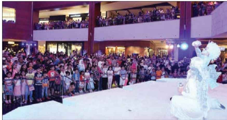
من فقرات العرض

استضاف «مول 360» وجهة التسوق الرائدة في الكويت والتابعة لشركة «التمدين لمراكز التسوق»، سلسلة من الفعاليات والأنشطة الترفيهية الشتوية على مدى 3 أيام خلال عطلة عيد الفطر المبارك. واحتشد رواد المول بأعداد كبيرة في البهو الرئيسي الذي اكتسى بحلة شتوية مذهلة، حيث أتاحت لهم فرصة الفوز بالعديد من الجوائز المقدمة من متاجر التجزئة في المول. أقيم هذا الحدث الاستثنائي وسط أجواء تفيض بالألوان النابضة، والمرح المتواصل، والمشاركة الواسعة لرواد المول الذين أمضوا أوقاتاً ممتعة خلال احتفالات العيد المتنوعة. وتضمنت الفعاليات مقابلة الدب القطبي، وعرض باليه ساحر، وعروض خفة اليد الشائقة. وشاركت في هذا الحدث الشخصية التلفزيونية الشهيرة كارين دير كالوستيان التي استمتع الأطفال بعروضها الحيوية المتميزة.