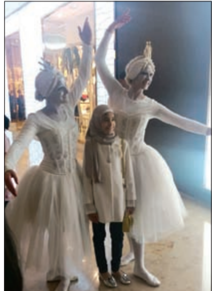
أجواء القطب الشمالي في مول 360

وأضافت لوبوسينسكا: «قدمنا هذا العام طيفاً أوسع من العروض المميزة من خلال مغامرات القطب الشمالي التي تم تصميمها خصوصاً لعملائنا. وتتوجه