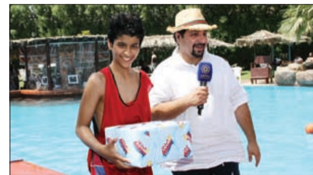
جائزة لأحد الفائزين