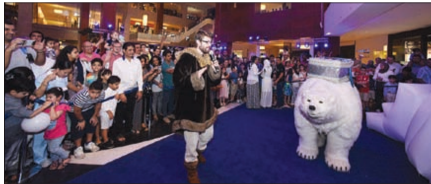
.. والدب القطبي داخل مول 360

بالتعاون والتحدي المستمر على اظهار الجراة والالتزام في أي عمل له، وتقديم كل ما هو جديد ومميز، وبالتعاون مع شركة روائع جنييف للساعات يقدمان لنا تحفاً فنية من الساعات الفاخرة، التي عبرت القارات بنسماط فرنسية أخاذة لتنتشر عبرها الفواح في بلاد الشرق منبع الأناقة والرفق. وهم دائماً على أهمية الاستعداد للرد على احتياجات عملائنا وشركائنا، ولتقديم خدمات عالية الجودة. المواصفات التقنية للساعة: صناعة سويسرية، محرك أوتوماتيكي موديل VDB Cal 15، علبة الساعة من الفولاذ المقاوم للصدأ، مقاومة للماء حتى عمق 300 متر، سوار الساعة متوافر بأصداًرين: الأول من الجلد الطبيعي ومدنورة بعدة ألوان، والثاني معدني متوافر باللون الذهبي الأصفر أو الفضي أو الذهبي الوردي، زجاج الساعة من الزفير النقي المقاوم للخدش.