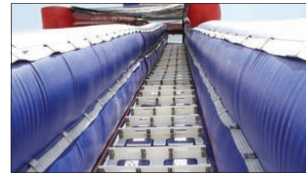
درج أكواتربو المعلقة