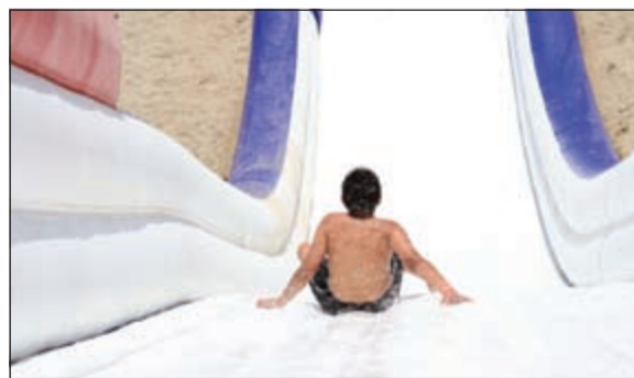
المتعة مع أكواتربو