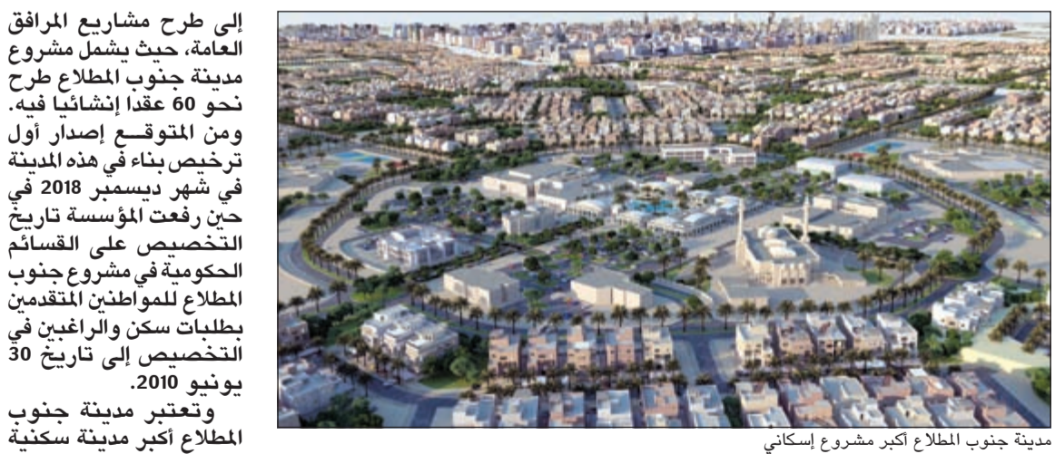
مدينة جنوب المطلاع اكبر مشروع إسكاني

إلى طرح مشاريع المرافق العامة، حيث يشمل مشروع مدينة جنوب المطلاع طرح نحو 60 عقداً إنشائياً فيه. ومن المتوقع إصدار أول ترخيص بناء في هذه المدينة في شهر ديسمبر 2018 في حين رفعت المؤسسة تاريخ الترخيص على القسائم الحكومية في مشروع المطلاع للمواطنين المتقدمين بطلبات سكن والراغبين في الترخيص إلى تاريخ 30 يونيو 2018. وتعتبر مدينة جنوب المطلاع أكبر مدينة سكنية في الكويت، حيث من المتوقع أن يصل عدد سكانها إلى نحو 400 ألف نسمة وتضم 116 مدرسة ونحو 156 مسجداً وتضم 12 ضاحية، وتبعد عن مدينة الكويت 40 كيلومتراً في الشمال الغربي من مدينة الجهراء وتضم 30 ألف وحدة سكنية.