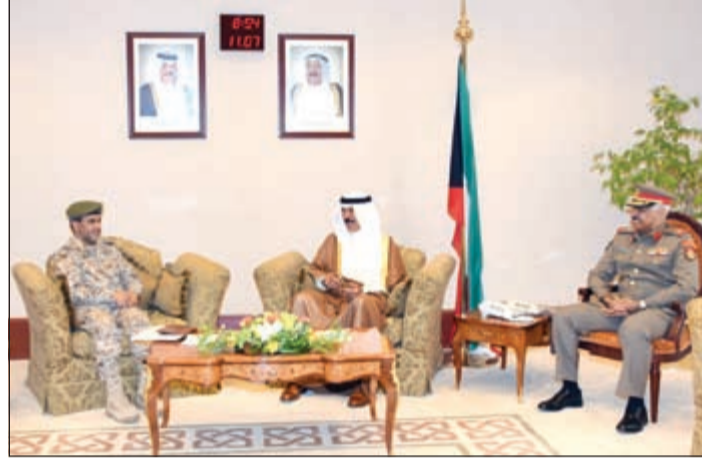
الشيخ محمد الخالد خلال استقبال معبوث ولي ولي العهد السعودي اللواء فهد سعود الجهني