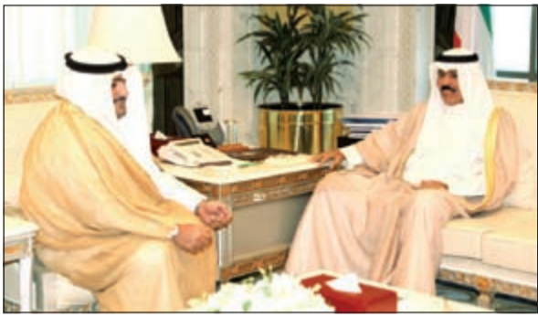
سمو نائب الأمير مستقبلاً الشيخ ثامر العلي

استقبل سمو نائب الأمير وولي العهد الشيخ نواف الأحمد بقصر السيف صباح أمس نائب رئيس مجلس الوزراء ووزير الداخلية ووزير الدفاع بالإتابة الشيخ محمد الخالد وبرفقته رئيس الأركان العامة للجيش الفريق الركن محمد الخضر. كما استقبل سمو نائب الأمير وولي العهد الشيخ نواف الأحمد رئيس جهاز الأمن الوطني الشيخ ثامر العلي.