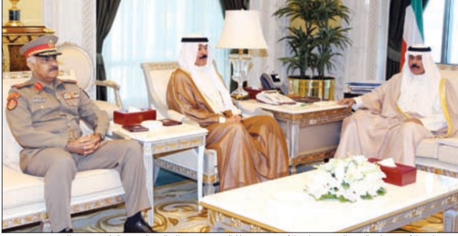
سمو نائب الأمير وولي العهد الشيخ نواف الأحمد مستقبلاً الشيخ محمد الخالد والفريق الركن محمد الخضر