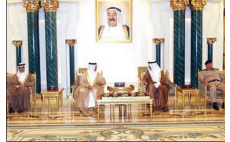
الشيخ محمد الخالد خلال استقباله وزير الداخلية بمملكة البحرين الفريق الركن الشيخ راشد بن عبدالله آل خليفة