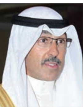
الشيخ فواز الخالد

توجه محافظ الاحمدي الشيخ فواز الخالد بالشكر الى مقام صاحب السمو الامير الشيخ صباح الاحمد بمناسبة الاعلان عن مشروع منتزه الشيخ نواف الاحمد الصباح بمنطقة الوفرة، مشيراً الى ان هذا المشروع يأتي في إطار حرص سموه على تحقيق اقصى درجات الرعاية للمواطنين والمقيمين على امتداد الكويت. وأكد الخالد استحقاق سمو ولي العهد لكل تقدير وتخليد، مقدراً حرص الديوان الاميري على تنفيذ توجيهات صاحب السمو الامير والتعجيل بالوفاء بالاحتياجات الخدمية والحضارية في جميع المناطق ونجاحه خلال السنوات الاخيرة في الاشراف على العديد من المشروعات الحيوية الناجحة، مشيداً بشراكة شركة نفط الكويت في مشروع منتزه الشيخ نواف الاحمد بمنطقة الوفرة