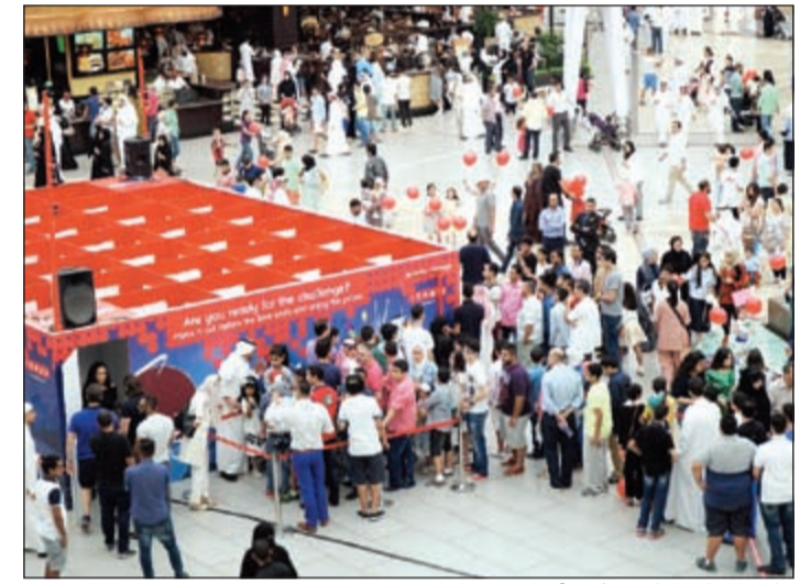
جانب من الاحتفال Ooredoo.