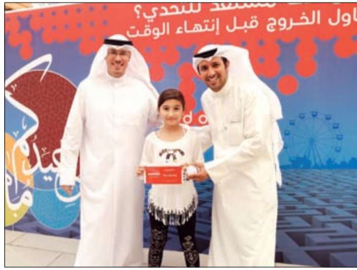
أحدى العميلات تتسلم جائزتها

يثير هذا السؤال كثيراً من الجدل وسط ارتفاع في درجة الحرارة بشدة في الآونة الأخيرة وعزم العديد من الكويتيين والمقيمين على السفر إلى خارج الكويت بغرض السياحة والهروب من طقس الكويت الحار، ولكن الحقيقة أيضاً أن بعض الدول التي يلجأون إليها قد تكون أيضاً شديدة الحرارة في إطار دول مجلس التعاون الخليجي والتي يلجأ إليها أيضاً مواطنو الدول الأوروبية للتمتع بحرارة الشمس وسياحة السفاري وسط الصحراء ووسط الأجواء البدوية. الأسباب عديدة لكي يأتي السائح إلى الكويت وسط تلك الأجواء الحارة التي تشهدها الكويت، منها وجود ارتباطات عائليّة من دول مجلس التعاون الخليجي لأهل الكويت ولزيارتهم خلال فترة الإجازات مهما كانت درجة الحرارة والدليل خلال اجازة عيد الفطر كنت تجد العديد من السيارات الخليجية تجوب شوارع الكويت، بالإضافة إلى دخول آلاف السيارات الخليجية إلى الكويت عبر منفذها البري، ومن ضمن الأسباب وجود المجمعات التجارية بالكويت والتي تشكل نوعاً جديداً من السياحة التي تطلق عليها سياحة التسوق، حيث تكون