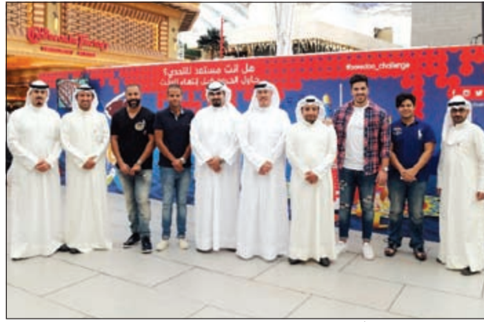
لقطة جماعية لعملاء Ooredoo، خلال الاحتفال بالعيد في الأفيوز