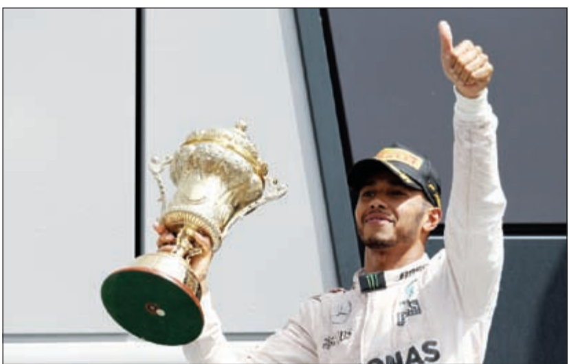
لويس هاميلتون حاملا الكأس

الذي حصل بينهما في السباق الماضي على حلبة سبيلبرغ النمساوية عندما حاول هاميلتون تجاوز زميله في اللفة الأخيرة فاقتل الأخير الطريق عليه، ما تسبب في كسر جانج سيارته الامامي وتراجعه إلى المركز الرابع، فيما أنهى زميله البريطاني السباق في المركز الأول. ووجه مدير الفريق تينو وولف انذارا نهائيا لسائقي ابطال العالم لأنها ليست المرة الاولى التي يتكبد فيها الفريق الألماني الخسائر بسبب الخصومة بينهما، ما جعل الانظار موجهة إلى معركتهما أكثر من أي وقت مضى، إلا ان الأمور سارت على ما يرام رغم انطلاقهما بجانب بعضهما تحت الاطار وخلف سيارة الامان.