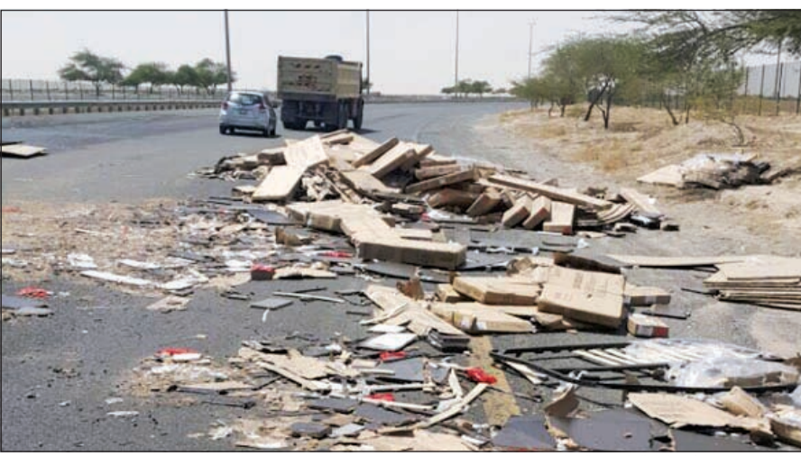
الخشب وقد تتعثر على الدائري السابع

فيما تبين أن الانقلاب الذي حدثت للشاحنة كان جراء انفجار احد اطاراتها.