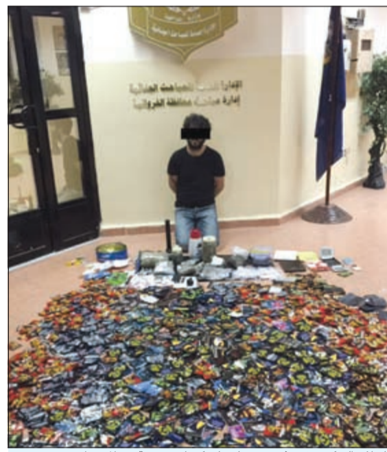
الحلاق التركي وقد عثر في منزله على كميات ضخمة من المخدرات

أمر وكيل وزارة الداخلية المساعد لشؤون الأمن الجنائي اللواء عبدالحميد العوضي بإحالة مواطن وحلاق تركي إلى النيابة العامة، وأرْفَق في ملف الإحالة كميات ضخمة من المواد المخدرة. ويحسب مصدر أمني فإن معلومات وردت إلى اللواء العوضي عن اتجار مواطن محكوم عليه بالمؤبد وتركي يعمل مديراً لصالون حلاقة في الجارية بالمواد المخدرة وعليه تم الإيعاز إلى مدير مباحث الفروانية والذي بدوره أجرى المزيد من التحريات وبعد استصدار إذن نيابي تم استدراج المتهمين لصفقة عبارة عن بيع كمية من الكوكايين والكيميكا، وبعد تسلم المبلغ المرقم وتسليم المخدرات تم ضبطهما وبتفتيش مسكنهما تم العثور على كميات ضخمة من المواد المخدرة.