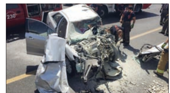
من حادث الدائري السابع