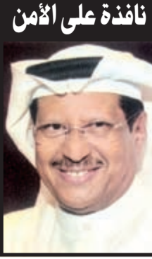
نافذة على الأمن

كشفت مخالفة عدم الالتزام بالخطوط الأرضية عن مواطن بحالة غير طبيعية في منطقة العيون بمحافظة الجهراء، وعثر معه على كيس من مادة مخدرة ومشروب خمر مستورد قام بوضعه في عبوة بلاستيكية. وقال مصدر أمني: إن رجال النجدة وأثناء تواجدهم بأحد طرق منطقة العيون رصدوا مركبة تسير بين الخطوط الأرضية، فتم إيقاف قائدها الذي تبين أنه بحالة غير طبيعية وسقط منه كيس يحتوي على مواد مخدرة، وبتفتيشه عثر معه