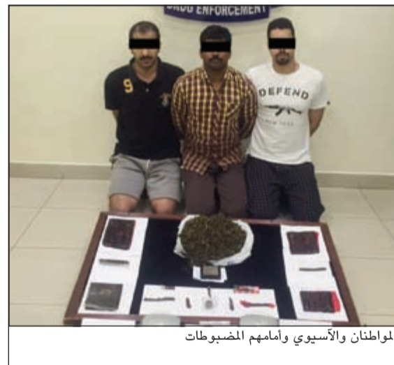
المواطن والأسوي وامامهم المضبوطات

أحسب مدير عام الإدارة العامة لمكافحة المخدرات 3 أشخاص إلى النيابة العامة بتهمة حيازة نحو 6 كيلو من مادتي الحشيش والشبو و100 غرام هيروين، ويحسب مصدر أمني فإن رجال مكافحة المخدرات وصلت