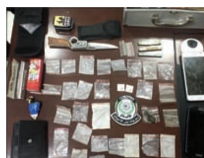
المضبوطات في قضية «التظليل»

وأحدهما اعترف بالاتجار في المخدرات، وتم التحفظ على المضبوطات وإحالة المتهمين إلى المكافحة، ويحسب مصدر أمني فإن رجال دورية أمن الأحمدية وخلال جولة في منطقة الظهر شاهدوا مركبة مظلمة بالكامل، وعليه تم الطلب من شخصين طلب رخصة السوق لتحريز مخالفة تبين أن الشخصين في حالة غير طبيعية واحدهما مطلوب للسجن 5 سنوات، وفي هذه الأثناء تمت مشاهدة صندوق صغير، وفتحه عثر فيه على كميات متفاوتة من المواد المخدرة (شبو وحشيش وجيوب).