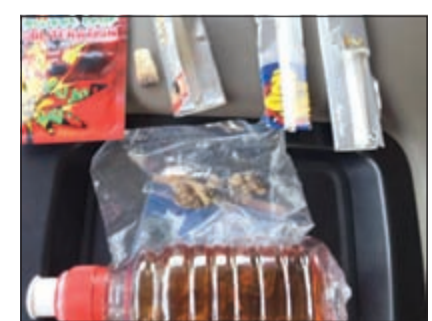
عبوة المخدر وكيس المواد المخدرة

على نصف سيجارة حشيش تم استخدامها بالإضافة إلى 3 اطرف ورق زاج، وكذلك كيس شفاف اللون بداخله مواد مخدرة، وعبوة بلاستيك شفافة اللون بداخلها مشروبات