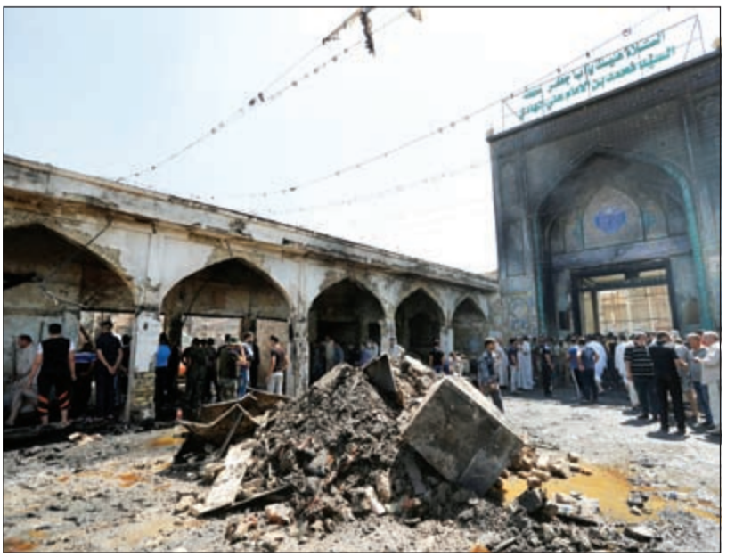
تفجير انتحاري جديد استهدف مرقد السيد محمد ابن الامام الهادي في محافظة صلاح الدين

واوضح البيان الصادر عن المتحدث باسم قيادة العمليات المشتركة ان اثنين من الانتحاريين فجرنا نفسيهما في سوق تجاري قريب من المرقد، في حين تم قتل الانتحاري الثالث وتفجيك حزامه الناسف. وتبنى تنظيم داعش الهجوم بحسب ما أوردت وكالة «اعماق» التي تنقل أخبار التنظيم المتطرف الذي غالبا ما يستهدف المدنيين. وقالت الوكالة أمس «هاجم 5 انفجاريين قبيل منتصف ليلة الجمعة تجمعوا للحشد الشيعي عند مرقد محمد بن علي الهادي في قضاء بلد صلاح الدين». بدوره، تبه الرئيس العراقي فؤاد معصوم إلى أن الاعتداءات الاجرامية لداعش الإرهابي، والتي كان آخرها التفجير الانتحاري الذي استهدف مرقد شيعي بقضاء «بلد» محاولة بائسة لاشغال الفتن الطائفية لضرب وحدة الشعب العراقي ضد الإرهاب وداعيا السلطات الأمنية لاتخاذ اجراء عاجلة لإلغاء القبض على الجنائز ليناوالا القصاص العادل.