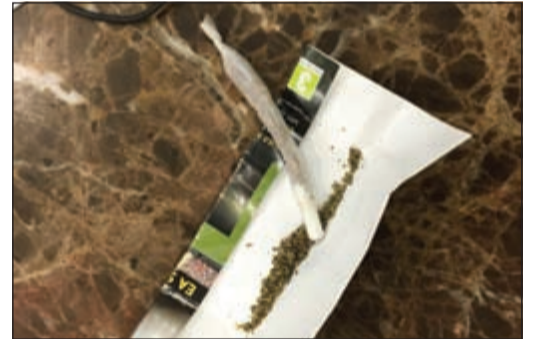
المخدرات المخبوطة مع المدين ومرافقه