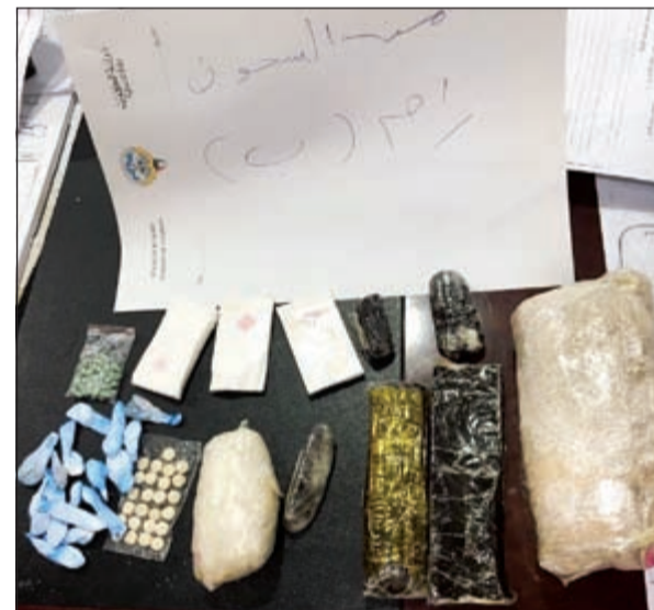
كوكيتيل المخدرات التي تم ضبطها بالسجون