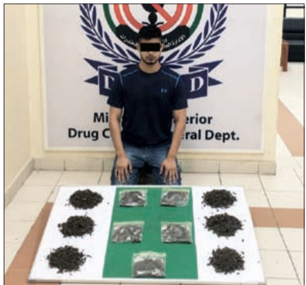
الوافد الهندي مع 2 كيلو ماريغوانا