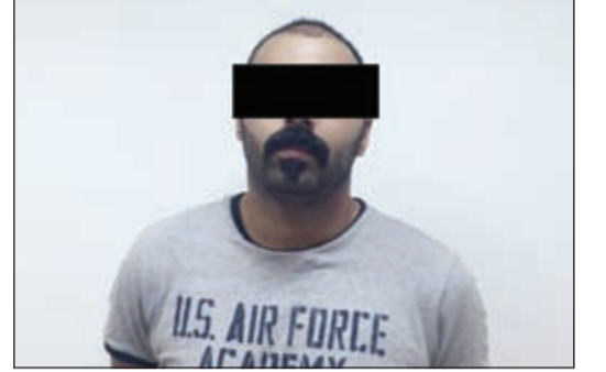
المتهم بعد انتهاء التحقيقات واعترافه