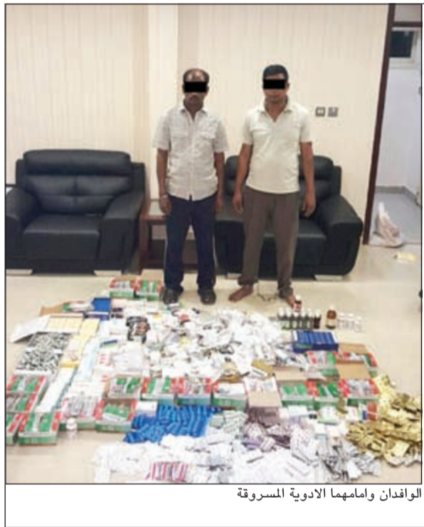
الوافدان وامامهما الادوية المسروقة