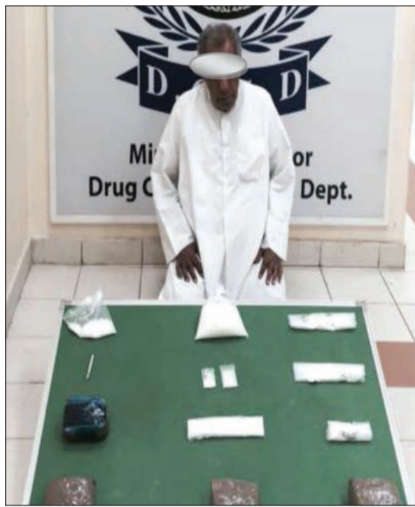
... «البدون»، والشبو المضبوط