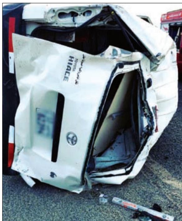
الباص عقب انقلابه على طريق الوفرة وقد تهشم من جميع جوانبه