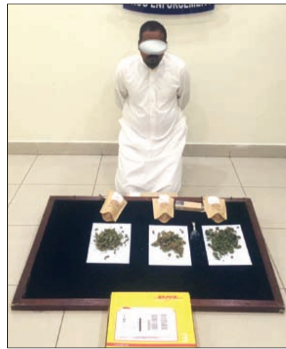
الوافد البريطاني وامامه الماريغوانا

المكافحة القبض على شخص من غير محدد الجنسية وعثر في منزله بالجهره على نحو 4 كيلو شبو، وقال مصدر امني ان البدون استدرج لبيع 50 غراما وضبط بعد تسلمه المخدر.