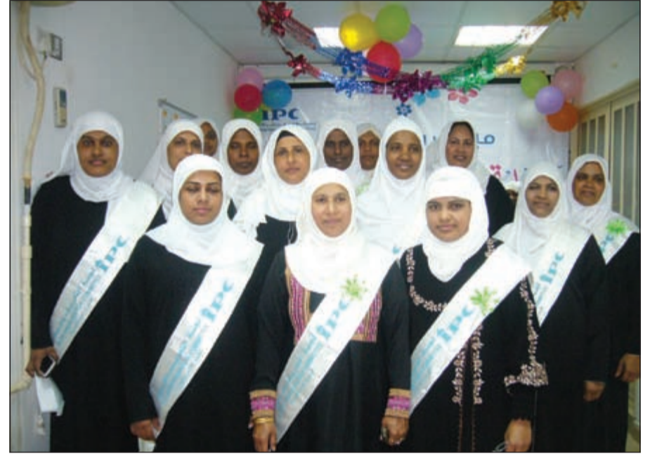
حفل تخرج المهتديات

مبادئ قراءة القرآن كما التحقت بدورات اللغة العربية التي تقدمها اللجنة تقطع كيلومتر مشياً على الأقدام. درست راضية دورة