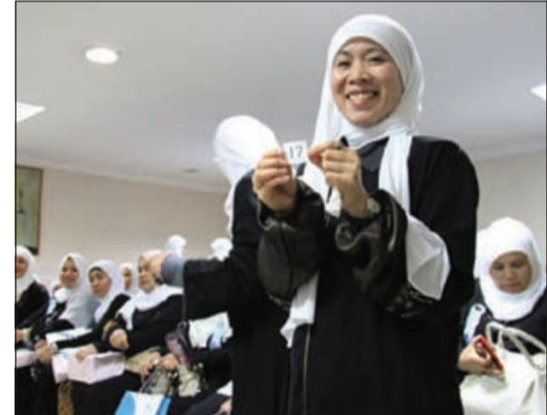
سعادة غامرة لمهتدية فائزة بجائزة أثناء الحفل