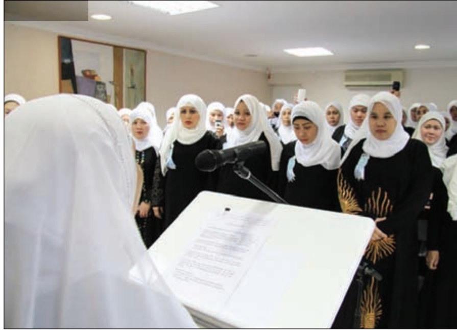
المهتديات يتابعن فقرات الحفل

فهنيئاً لعبد أعزه الله تعالى بعد ذلة، فصارت العزة خلة له وجيلة، يعفو عن ظلمه، ويصفح عن خصمه.