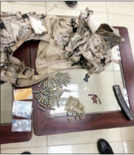
الطلقات والملابس العسكرية والحبوب المضبوطة