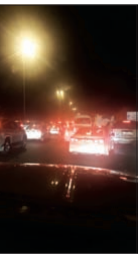
عمود الإنارة الى جانب الطريق وكذلك الشاحنة.