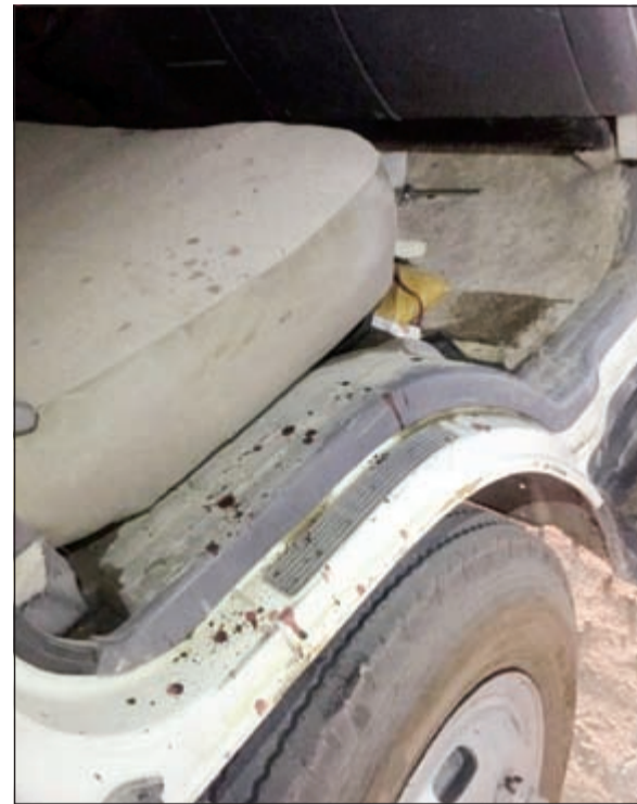
المركبة التي استدرج إليها المجني عليه

لتنعش على جثته ملقاة في ساحة فضاء بمدينة جابر الاحمد وقد تعرض للضرب بالآلات حادة على رأسه كما لوحظ وجود طعنات في اجزاء متفرقة من جسده. وبينت الادارة ان التحريات دلت على وجود ثار للقتيل مع بعض ابناء منطقته حيث يقيمون في السكن نفسه، وقد استدرجه القاتلان لتنفيذ جريمتهم اخذا بثارها منه ثم غادرا البلاد فجر امس، حيث تم التنسيق والقبض على القاتلين فور وصولهما مطار القاهرة الدولي، وتم التحفظ عليهما تمهيدا لاحالتهما الى جهة الاختصاص، وجار استكمال البحث والتحري لتلك القضية.