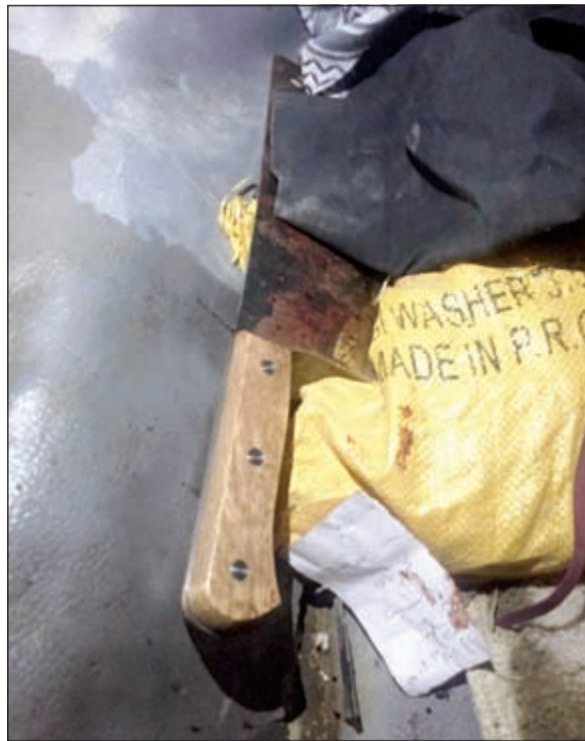
الساطور المستخدم في الجريمة