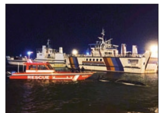
القارب الذي تم انتشاله