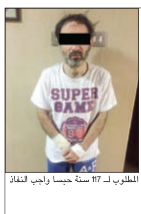
المطلوب بـ 117 سنة حيسا واجب النفاذ

شروع رجال ادارة بحث وتحري محافظة الفروانية في البحث عن صاحب مركبة اميركية اقدم على خطف وافدة ومحاولة الهرب بها الى منطقة مجهولة ورغم توسلاتها بان يتركها وحال سبيلها الا ان