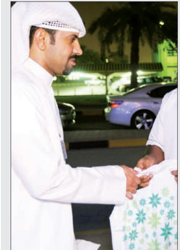
جانب من حملة «هون عليهم»