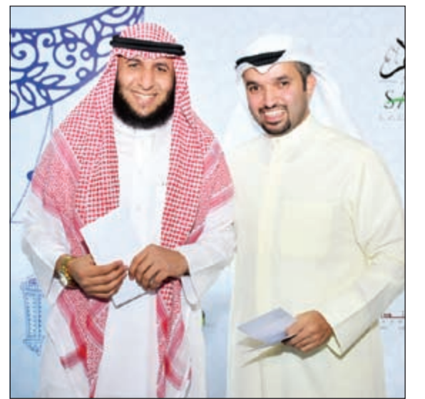
جانب من تكريم الموظفين

كعادتها السنوية ووسط أجواء مفعمة بالبهجة والسرور، أقامت مجموعة السلام القابضة غبقتها السنوية، وسط أجواء رمضانية تخللها توزيع جوائز تقديرية لموظفيها المتميزين. وحضر الغبقة لغيف من كبار قياديي المجموعة وشركاتها التابعة، وبهذه المناسبة رحبت الرئيس التنفيذي د.سارة الشمالي بالحضور، وعبرت عن شكرها للجميع على تلبية الدعوة والمشاركة في إحياء اللقاء السنوي. وقالت الشمالي: إن هذه الغبقة تمثل فرصة للتواصل بين موظفي مجموعة السلام وشركاتها التابعة في مثل هذه الأجواء الرمضانية الخاصة. وأضافت أن قياديي المجموعة مقتنعون