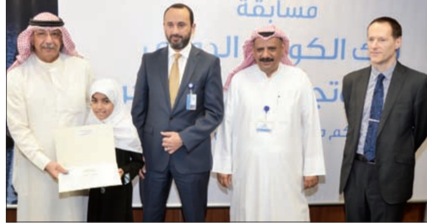
.. ويكرم إحدى المشاركات