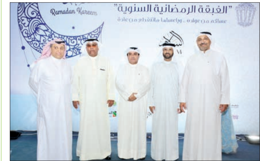
فريق الإدارة العليا في مجموعة السلام القابضة وشركاتها التابعة