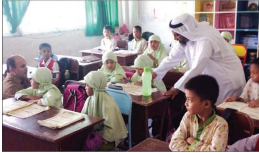
كفالة الأيتام جانب حيوي في أنشطة «الرحمة العالمية»

وأن يشهد مراقبة الله تعالى؛ وذلك بأن يؤدّي العبد شرائع الله تعالى كأنه يراه، وهذا المشهد إنما ينشأ من كمال إيمان العبد بالله تعالى ومعرفة أسمائه الحسنى وصفاته العلى، فمن راقب الله تعالى مُستحضراً ما وصف الله تعالى به نفسه في كتابه: فإنه يعبد الله تعالى كأنه يراه، فإن لم يكن يراه: فإنه يعلم أنّ الله سبحانه يراه؛ وهو فوق سمواته مُستوياً على عرشه، يتكلم بأمره ونهيه، ويُدبر أمر الخليقة، فينزل الأمر من عنده ويصعد إليه، ويُعرض عليه أعمال العباد وأرواحهم عند الوفاة، فيشهد هذا العبد: رباً حياً؛ وإلهاً قوياً؛ سمياً بصيراً؛ عزيزاً حكماً؛ أمراً ناهياً؛ مُحِبّاً ويُبغض، ويرضى ويغضب، ويفعل ما يشاء ويحكم ما يُريد، وهو فوق عرشه لا يخفى عليه شيءٌ من أعمال العباد ولا أقوالهم ولا بواطنهم، بل يعلم خائنة الأعين وما تخفي الصدور، فيشهد ذلك كله بقلبه، فمشهد الإنسان: هو أصل أعمال القلوب كلها، لأنه يُوجب الحياء والإجلال والتعظيم والخشية والمحبة والإنابة والتوكل والخضوع والذل له سبحانه وتعالى، ويقطع الوسواس وحديث النفس، ويجمع القلب والهَمَّ على الله تعالى، فحظّ العبد من القرب من الله تعالى: على قدر حظه من مشهد الإحسان، وبحسبه تتفاوت الصلوات؛ حتى يكون بين صلاة الرجلين - المتجاورين في صف الصلاة - من الأجر والفضل وتكفير السيئات: كما بين السماء والأرض، وقياهما وركوعهما وشجورهما؛ واحد، وهذا المشهد العظيم: يستدعي توكل العبد على الله تعالى في تحقيقه، كما قال الله تعالى: ﴿وَتَوَكَّلْ عَلَى الْعَزِيزِ الرَّحِيمِ (217) الَّذِي يَرَاكَ حِينَ تَقُومُ (218) وَتَقَلِّبُكَ فِي السَّجْدِ (219) إِنَّهُ هُوَ السَّمِيعُ الْعَلِيمُ﴾.