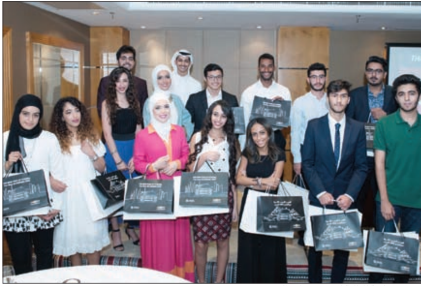
صورة جماعية للطلبة المتدربين خلال الحفل

عقدت شركة صناعات الغانم، إحدى أكبر الشركات الخاصة في المنطقة الأسبوع الماضي، حفلاً في فندق جي دبليو ماريوت لتخريج 15 طالباً من برنامج التدريب الصيفي الذي امتد على أربعة أسابيع منذ بداية شهر يونيو.