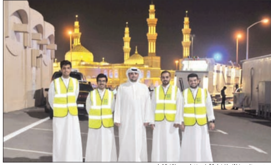
فريق «بيتك» خلال المشاركة في تنظيم صلاة القيام

مع كل مكوناته. وتأسس «بيتك»، المؤسسة المالية المبرجة في سوق الكويت للأوراق المالية عام 1977 ومقره في الكويت، وتعتبر مجموعة «بيتك» رائدة عالمياً في مجال الخدمات المصرفية الإسلامية، حيث توفر مجموعة واسعة من المنتجات والخدمات المتوافقة مع أحكام الشريعة الإسلامية وتقدم مستوى فائقاً من الابتكار وخدمة عملاء متميزة. ويدير البنك عملياته في دول مجلس التعاون الخليجي وآسيا وأوروبا من خلال أكثر من 446 فرعاً بما في ذلك بيت