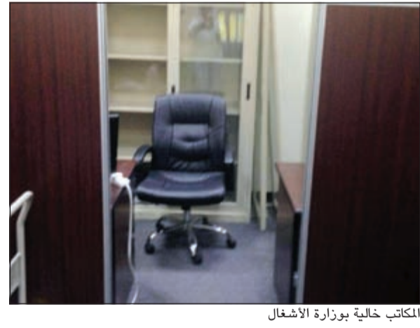
المكاتب خالية بوزارة الأشغال

في هذا السياق كشفت مصادر تربية مطلة لـ «الانباء» ان نسبة تغيب الموظفين وصلت الى الثلث، مشيرة ان الوزارة ستطبق عليهم نظم ولوائح الغياب. وأضافت انه من المستف ان ترى نسبة غياب مرتفعة وهو ما سينعكس بالسلب على المراجعين الذين اتى بعضهم لاستكمال معاملته ووجد الكثير من المكاتب خالية مطالبة بضرورة تشديد العقوبات خاصة في مثل هذه الظروف لعدم تكرارها مستقبلاً.