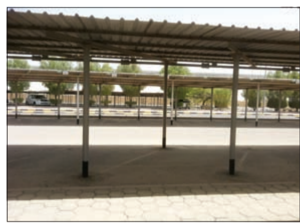
مواقف التربية خالية من سيارات المراجعين