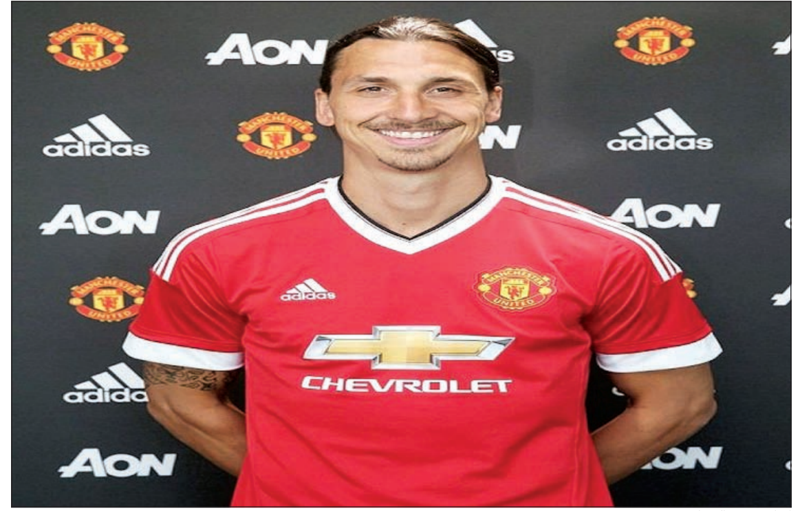
ابرا بقميص اليونان

يسعى نادي أرسنال الإنجليزي، للبقاء على مهاجم الفريق، الدولي التشيلي اليكسيس سانشيز. وأبدى نادي يوفنتوس الإيطالي، اهتمامه بسانشيز خلال الأيام الماضية، وهو ما أثار قلق أرسين فينغر المدير الفني للغانرز. وبدأ فينغر المفاوضات مع سانشيز خلال الساعات الماضية، من أجل إقناعه بتمديد تعاقد مع الفريق. ويخطط فينغر لتمديد عقد سانشيز حتى عام 2020، وبراتب أسبوعي تبلغ قيمته 160 ألف جنيه إسترليني.