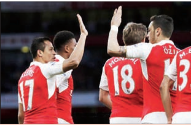
عرض سخى للبقاء على التشيلي