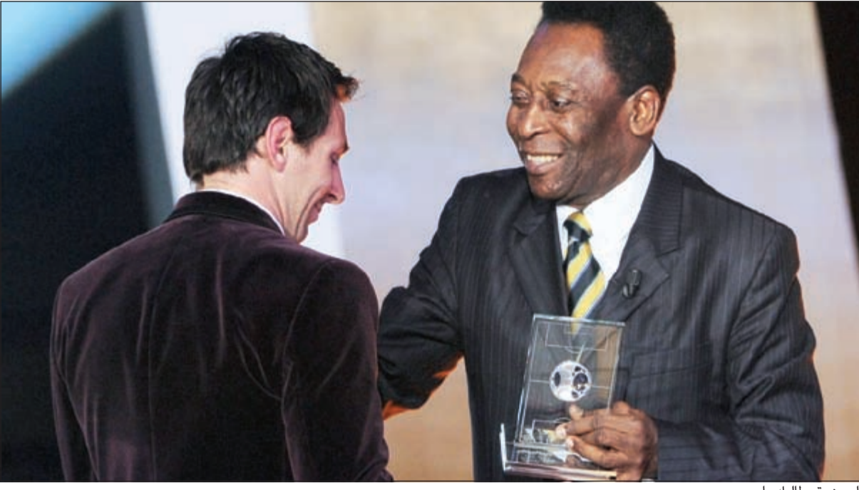
الجوهرة يطالبك يا ميسي