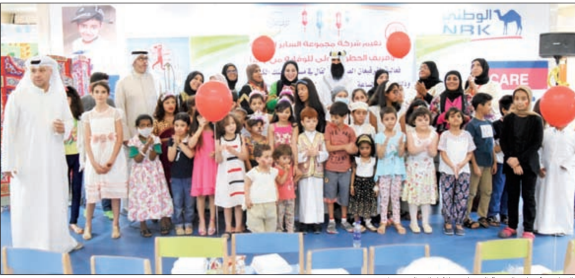
«الساير» أدخلت البهجة إلى قلوب الأطفال بالقرقيعان

بالتعاون مع شركة الساير الطبية واهتماما منها بالأطفال ونشر السعادة في رمضان مجموعة الساير القابضة تنشر السعادة وتحفل بالقرقيعان في مستشفى بنك الكويت الوطني