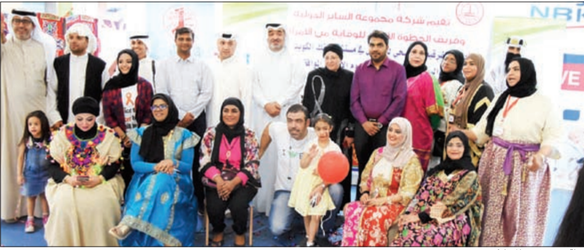
لقطة مع عدد من المشاركين

بالتعاون مع شركة الساير الطبية واهتماما منها بالأطفال ونشر السعادة في رمضان مجموعة الساير القابضة تنشر السعادة وتحفل بالقرقيعان في مستشفى بنك الكويت الوطني