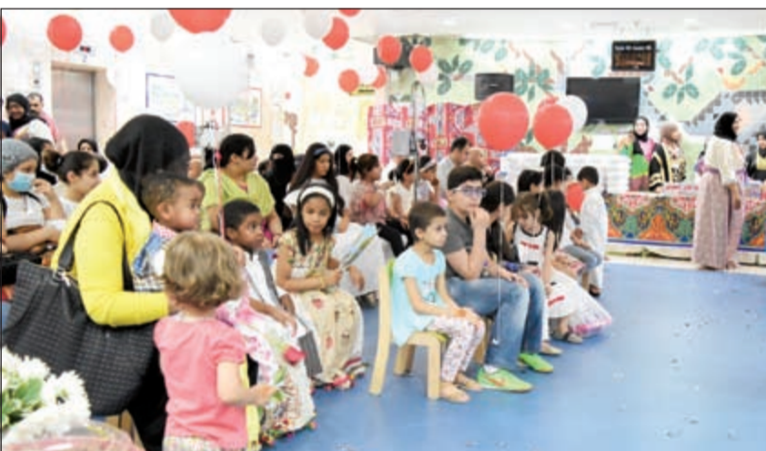
متابعة من الأطفال للفقرات