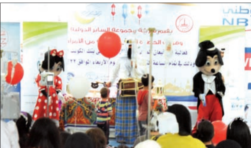
فكرة ترفيهية للأطفال