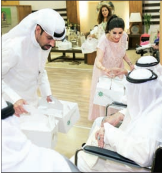
هدايا من «التجاري» لكبار السن