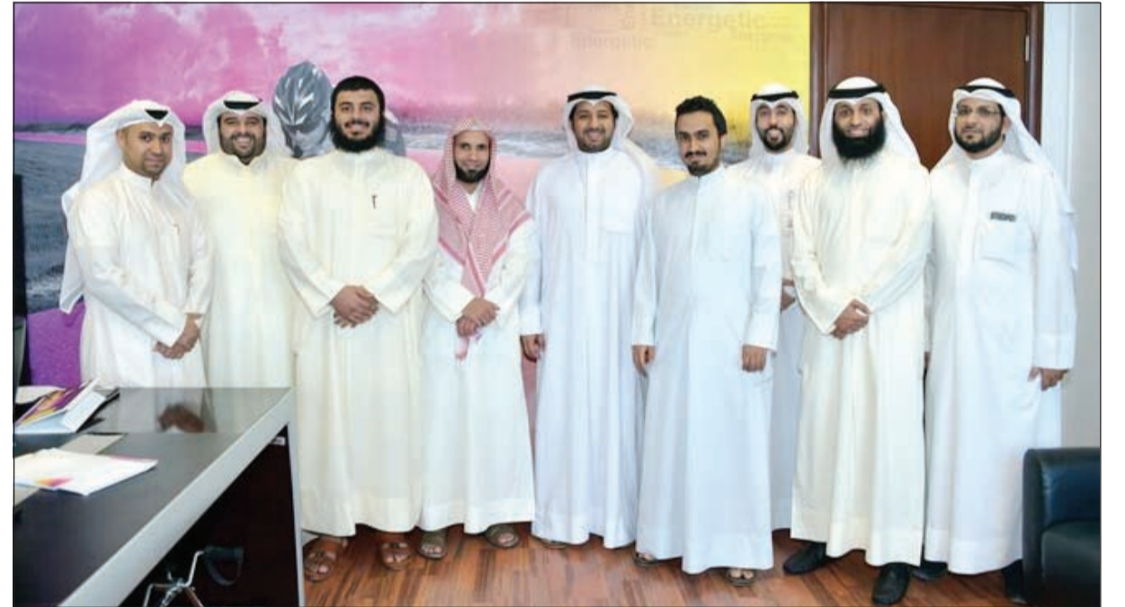
لقطة للفائزين بمسابقة تلاوة وتجويد القرآن الكريم

الحسنة وقدرتهم على التجويد والتلاوة وفقاً للأحكام القرآنية، وقامت اللجنة بتكريم الفائزين وتقديم الجوائز لهم وهي عبارة عن جهاز Lite Huawei P8 وتعتبر هذه المسابقة الأولى من نوعها التي تقيمها VIVA لموظفيها، وذلك بهدف حثهم على إبراز مواهبهم وإبداعاتهم،