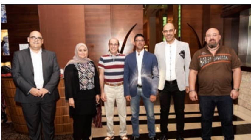
أعضاء مجلس الإدارة

إلى تطوير هذه الصناعة ضمن بيئة متمثلة في الإبداع والمنافسة الشريفة، بالإضافة إلى العمل بروح الفريق الواحد المتصمت بأخلاقيات المهنة المتعارف عليها دولياً والارتقاء بمستوى المهنة خصوصاً في الكويت على أساس مواكبة التطور السريع في صناعة الإعلان دولياً. كما دعا بسام