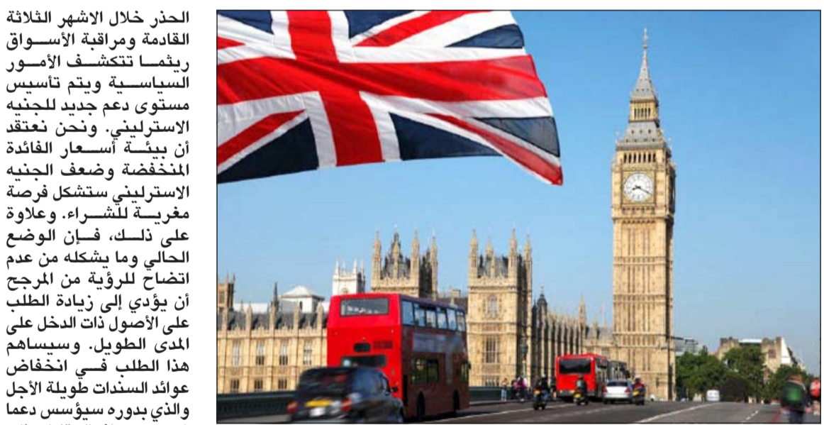
لايزال سوق العقارات التجارية في بريطانيا قويا كما كان قبل التصويت

الحذر خلال الأشهر الثلاثة القادمة ومراقبة الأسواق ريثما تتكشف الأمور السياسية ويتم تأسيس مستوى دعم جديد للجنيه الإسترليني. ونحن نعتقد أن بيئة أسعار الفائدة المنخفضة وضعف الجنيه الإسترليني ستشكل فرصة مفريية للشراء. وعلاوة على ذلك، فإن الوضع الحالي وما يشكله من عدم اتضاح للرؤية من المرجح أن يؤدي إلى زيادة الطلب على الأصول ذات الدخل على المدى الطويل. وسيساهم هذا الطلب في انخفاض عوائد السندات طويلة الأجل والذي بدوره سيؤسس دعما لمستوى عوائد الحفارات ذات دخل طويل الأجل. وذكر الخالد «أن المستثمرين المقيمين في الدول التي ترتبط عملاتها بالدولار سيتأثرن بشكل مباشر وفوري بتقلبات العملة. فالاستثمارات العقارية التي تمت في المملكة المتحدة خلال الأشهر 12 الماضية منبت بخسائر غير محققة تتراوح بين 15% و15% جراء تراجع سعر الجنيه الإسترليني مقابل الدولار». وتوقع مدير وحدة إدارة الأصول في «غلوبل» أن يشهد الجنيه الإسترليني اتضاح الرؤية وتراجع حالة عدم اليقين. وعلاوة على ذلك، يمكن أن يؤثر مجلس الاحتياطي الفيدرالي الأميركي قراره برفع أسعار الفائدة قبل العام المقبل لعدم الاستقرار الاقتصادي والمالي في الأسواق العالمية مما يدعم الجنيه الإسترليني. كما أن استمرار انخفاض أسعار الفوائد في المملكة المتحدة وأوروبا سوف توفر مزيدا من الحوافز لأسواق العقارات المعنية.