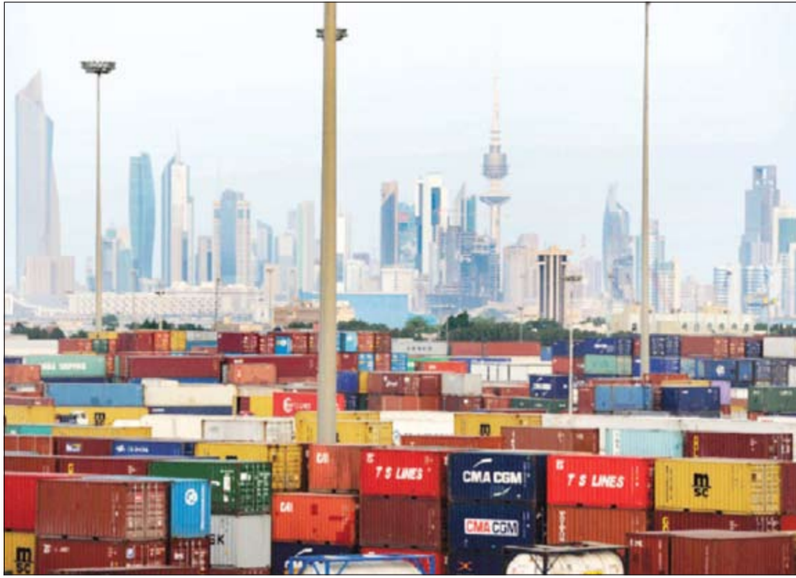
من المتوقع أن تستعيد الإيرادات قوتها في الكويت خلال الربع الثاني مع الارتفاع الملحوظ لأسعار النفط

قال تقرير إدارة البحوث الاقتصادية في بنك الكويت الوطني إن فائض الميزان التجاري للكويت استمر بالتراجع في الربع الأول من العام 2016 إثر تدني أسعار النفط ليصل إلى 400 مليون دينار نتيجة تراجع إيرادات تصدير النفط، ومن المحتمل أن يرتفع الفائض قليلا في الربع الثاني من العام 2016 نتيجة تعافي أسعار النفط.