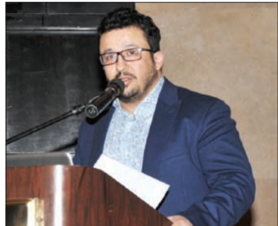
المخرج الكويتي يعقوب المهنا