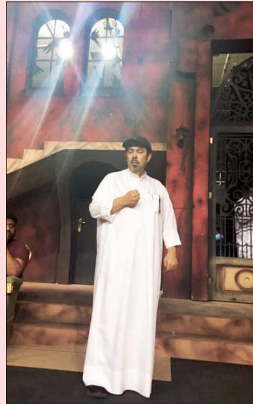
المسلم في «البيت المسكون 3»