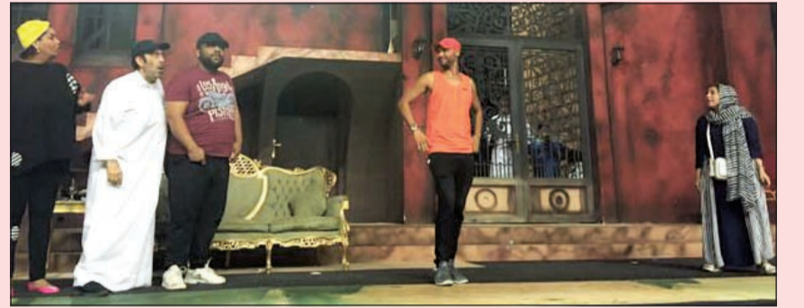
من بروقات المسرحية