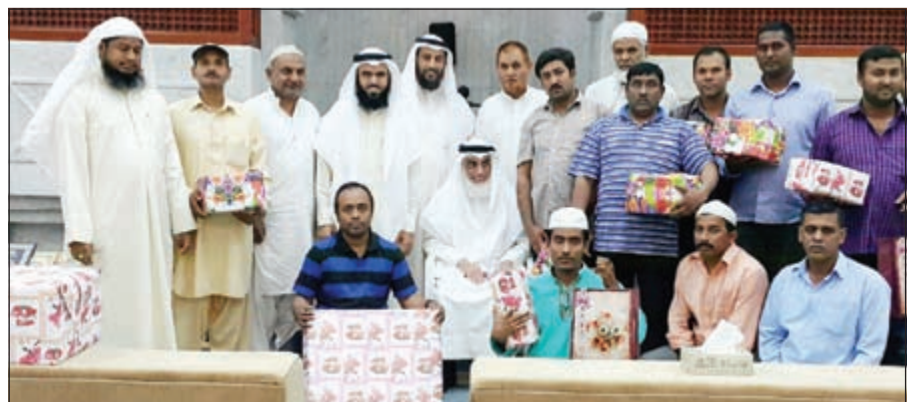
لقطة تذكارية للمحاضرين وعدد من المشاركين في الدورة

أقام مشروع «منار السبيل» لدعوة الجاليات، دورة علمية في شرح كتاب التوحيد ومسابقة سؤال وجواب للجالية الأردنية، وتم تكريم الفائزين في المسابقة، وذلك في مسجد بيبي البدر بمنطقة الصباحية، علماً بأن المشروع لديه بعض الأنشطة الدعوية للجاليات، كما أن المشروع لديه ما يقارب 80 طالباً. وقد صرح الشيخ حسن العجمي في كلمة القاها في ختام الحفل التكريمي بأن الهدف من هذا المشروع تعليم الجاليات وتوعيتهم، ولا سبيل لذلك إلا بالتفقه