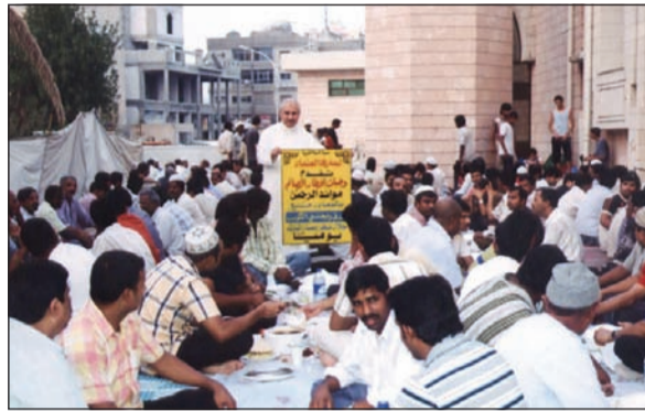
افطار الصائم في لجنة «العثمان»

وكان مع ذلك قد ابتلاه بالشهوة والغضب والغفلة، وابتلاه بعدوه إبليس لا يفتر عنه، فهو يدخل عليه من الأبواب التي هي من نفسه وطبعه فتميل نفسه معه، لأنه يدخل عليها بما تحب، فيتفق هو ونفسه وهواه على العبد، ثلاثة مسلطون أمرين، فيبعثون الجوارح في قضاء وطهرهم، والجوارح آلة منقاد فلا يمكنها إلا الانبعاث، فهذا شأن هذه الثلاثة وشأن الجوارح، فلا تزال الجوارح في طاعتهم كيف أمروا، وأين يمشوا، هذا مقتضى حال العبد.