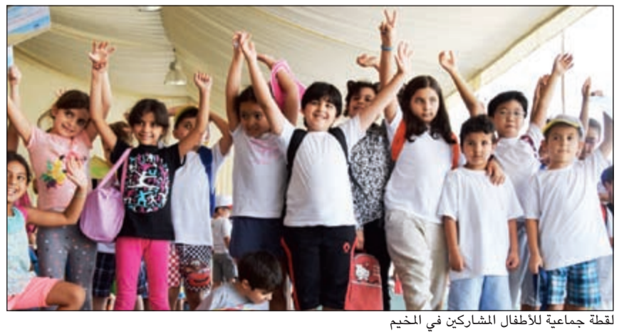
لقطة جماعية للأطفال المشاركين في المخيم