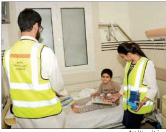
هدية لأحد الأطفال