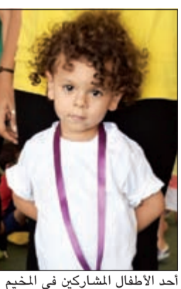
أحد الأطفال المشاركين في المخيم

أعلنت شركة علي عبدالوهاب المطوع التجارية اليوم عن مشاركة العلامة التجارية «كروكس» في مخيم «أرجانا» الصيفي من خلال إقامة «يوم كروكس» الترفيهي في 23 يونيو، والمشاركة في الاحتفالات بالقرقيعان في 28 يونيو 2016.