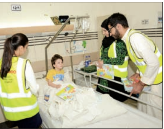
متطوعو برنامج «نعين ونعاون» يوزعون الهدايا على الأطفال

البرنامج التطوعي الداخلي الذي يهدف نحو دعم الأسر غير القادرة على تحمل تكاليف العلاج، والمشاركة في الفعاليات الخيرية لجمع التبرعات. أما زيارة الفريق التطوعي لمستشفى الرازي وابن سينا فقد تخللها توزيع الهدايا على المرضى وذويهم وعلى أفراد الهيئة التمريضية، تهنئة لهم بحلول الشهر الكريم ومشاركة لفرحة الأعياد. وتأتي هذه الزيارات ضمن برنامج المسؤولية الاجتماعية الذي تتبناه الشركة وجزءا رئيسيا من الأنشطة والمبادرات الخيرية التي تقيمها خلال شهر الخير والحب والعطاء. والجدير