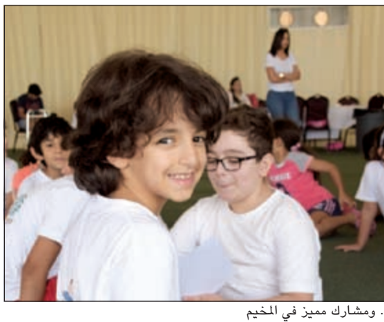
..ومشارك ممين في المخيم