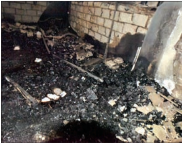
الحريق أتى على الأخضر والبياض

شهدت منطقة الفروانية قطعة 2 أكثر الحرائق مأساوية خلال السنوات العشر الأخيرة، على أقل تقدير، إذ تسبب حريق اندلع في منزل عربي، مخالف لأدنى اشتراطات الأمن والسلامة، في مصرع 9 وافدين باكستانيين بينهم أطفال ونساء، فيما أصيب 8 وافدين ورجلا إطفاء. وحمل نائب مدير عام الإدارة العامة للإطفاء لشؤون الوقاية اللواء خالد المكراد مسؤولية هذا الحادث المأساوي إلى ملك العقار وكذلك قاطنوه والذين لم يبالوا بأرواحهم ان سكنوا في منزل أقل ما يوصف انه عشوائي، ويفتقر إلى مداخل ومخارج، مشيرا الى ان العدد