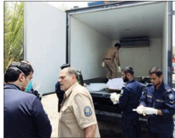
رجال الإسعاف ينقلون جثث الضحايا