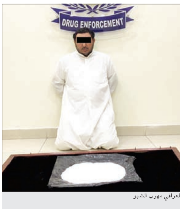
العراقي يهرب الشبو