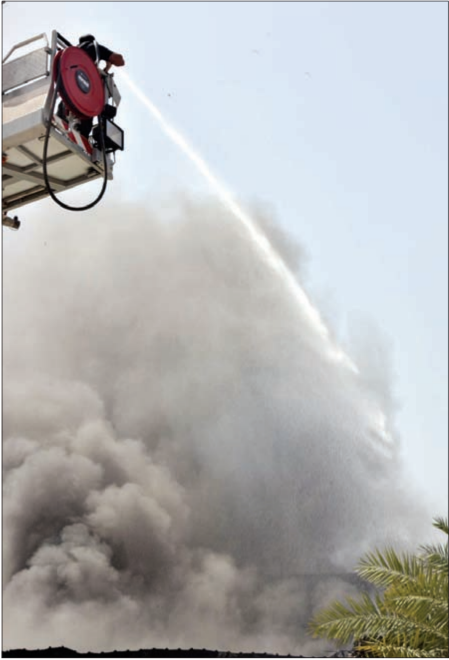
أحد رجال الأمن يطمئ الحريق بسوائل الإطفاء