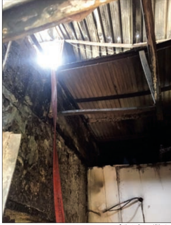
غرف الألبانوم العشوائية