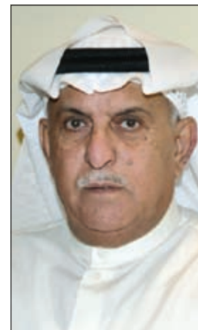
الخبير الفلكي عادل المرزوق

سرعتها على 55كم/ساعة اعتباراً من يوم غد الجمعة حيث سستزداد قوتها يوم السبت المقبل مثيرة الغبار العالق خلال هذه الأيام، وهذه الرياح سوف تشمل منطقة الخليج من شمال الكويت حتى قطر.