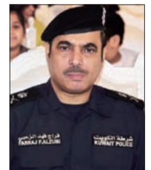
اللواء فراج الزعبي

احال مدير عام مديرية أمن محافظة مبارك الكبير اللواء فراج الزعبي الى قطاع المكافحة وافداً أسبوعياً لحيازة مواد مخدرة بقصد الاتجار، ولعبت مجاهرة الوافد بالإفطار بواسطة سيجارة دوراً في كشف حيازته للمواد المخدرة، وبحسب مصدر امني فإن إحدى دوريات أمن محافظة مبارك الكبير وخلال جولة لها في منطقة صباح السالم قبل افطار امس الاول شاهدت وافداً سيلانيا يدعى «رفيكوفار» يدخل سيجارة في نهار رمضان، ليتم توقيفه ويتفتشاه احترازيًا عن بحوزته على 200 غرام ماريغوانا.