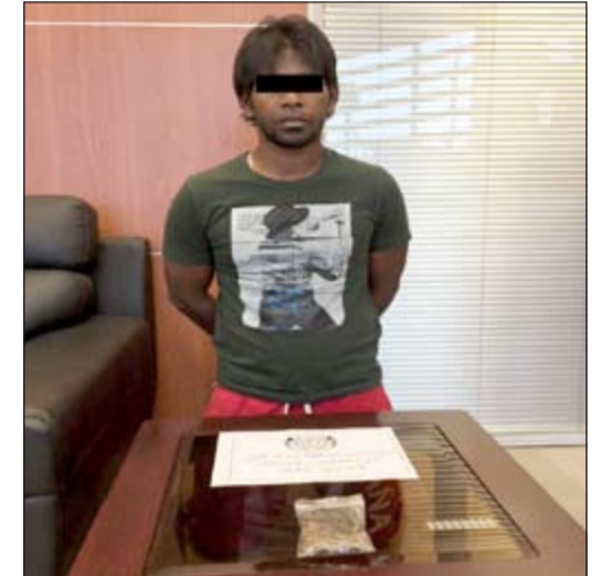
الجاهر بالإفطار وأمامه المضبوطات