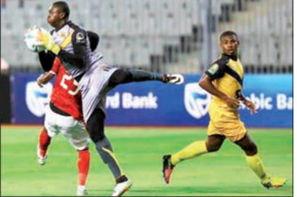
فرصة الاولية امام مرمي اسيك