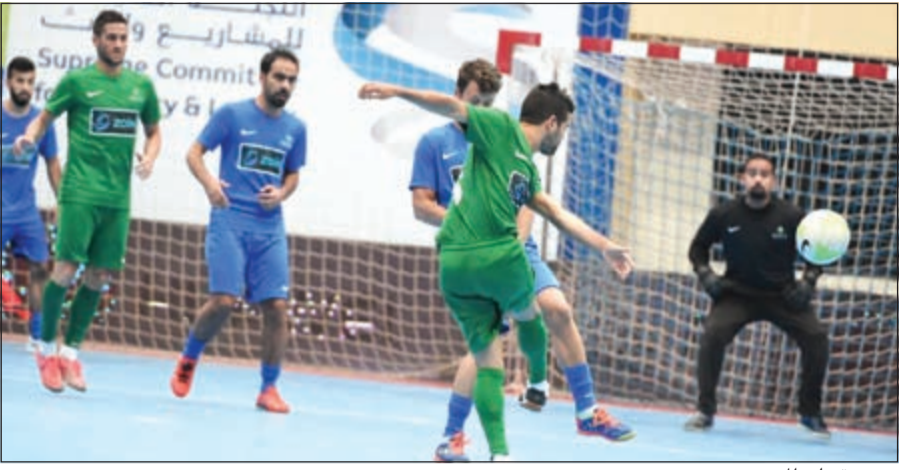
تسديدة على الرمي