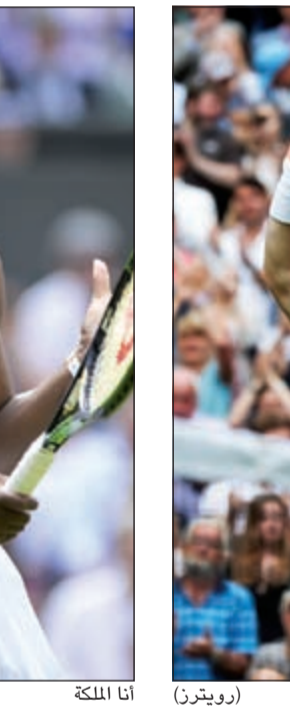
فعلها موراي بسهولة (روبيرتو)

بطولة مليونر لكنها تلقت الصدمة الاولى بخسارتها امام الالمانية انجيليك كيربر. وقدمت عرضا قوية في رولان غاروس لكنها فشلت في اجتياز الحاجز النهائي مجددا، وهذه المرة سقطت امام الإسبانية غاريني موغوروسا، ضحيتها في نهائي ويمبلدون 2015. وستسعى بالتالي جاهدة الى احراز لقبها الثامن في ويمبلدون والثاني والعشرين في بطولات الفراند سلام خلال مسيرتها الأسطورية.