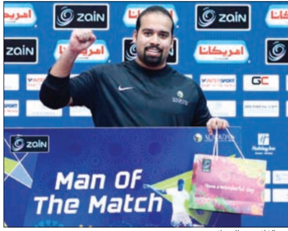
أحد الفائزين بالجوائز