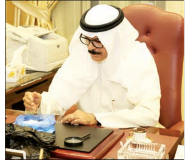
الشيخ محمد الخالد يطلع على طرق تهريب حديثة