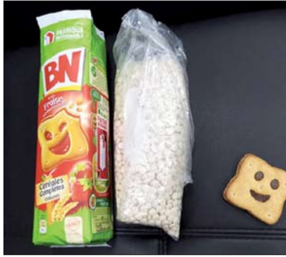
الحبوب هربت داخل علب بسكويت