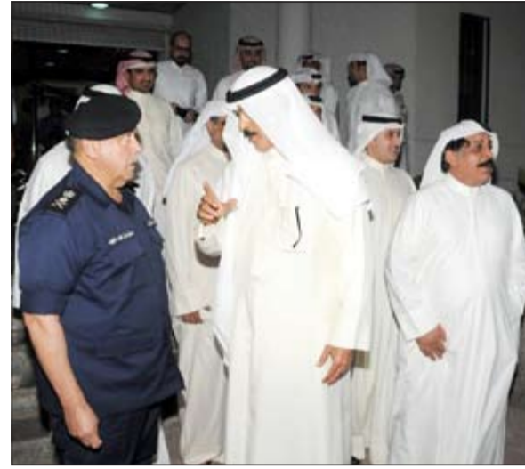
الوزير الخالد والفريق الفهد في حديث حول ضبطيات المخدرات