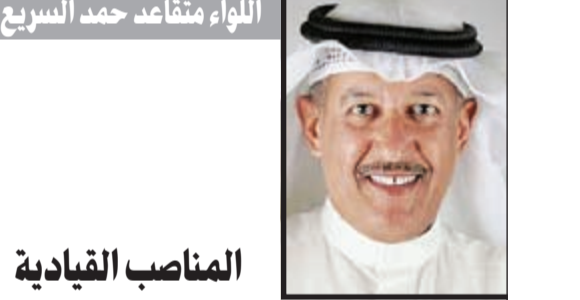
اللواء متقاعد حمد السريع