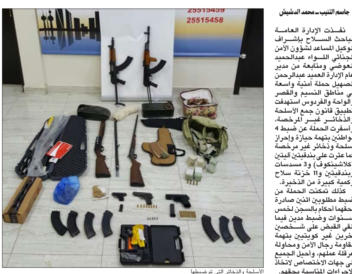
الأسلحة والذخائر التي تم ضبطها