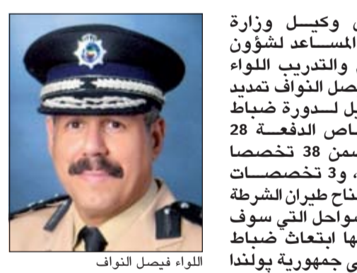
اللواء فيصل النواف

عبر موقع وزارة الداخلية الإلكتروني (www.moi.gov.kw) حتى العاشرة من مساء الأحد المقبل على أن يستمر استقبال طلبات الالتحاق الإفتني التالي. وأوضح أن التخصصات المطلوبة لنجاح طيران الشرطة هي (هندسة ميكانيكية - هندسة كهربائية - هندسة الكترونية) وأن التسجيل