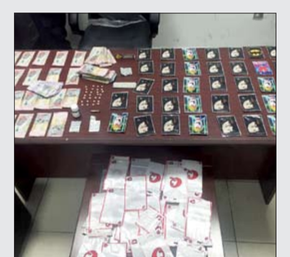
كوكيتيل المخدرات التي ضبطت مع المروج