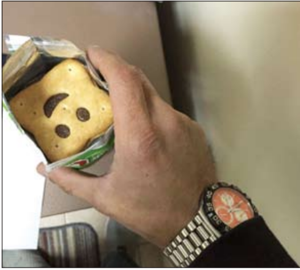
... وظاهر العلب من الأعلى يخفي الحبوب أسفلها