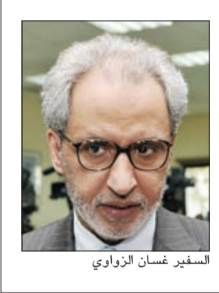
السفير غسان الزواوي

صاحب السمو استقبل رئيس مجلس النواب العراقي الزواوي لـ «الأنباء»: الجبوري نقل هموم العراق والرغبة في تعزيز العلاقات بين البلدين الجارين