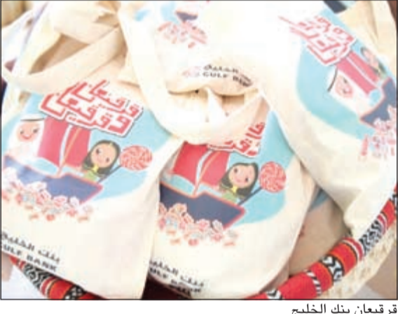
قرقيعان بنك الخليج

قام بنك برقان مؤخراً بتنظيم زيارة بمناسبة القرقيعان لنزلاء دور الرعاية التابعة لوزارة الشؤون الاجتماعية والعمل. وقد جاءت هذه الزيارة بهدف رسم البهجة والابتسامة على وجوه الأطفال وزرع السعادة والأمل في قلوبهم في شهر رمضان المبارك. وقام ممثلو قسم الاتصالات التسويقية في بنك برقان بزيارة المسنين والأطفال الأيتام وذوي الاحتياجات الخاصة لتوزيع هدايا القرقيعان عليهم ومشاركتهم هذه الاحتفالات في الشهر الفضيل. ولطالما أكد بنك برقان على التزامه نحو المجتمع من خلال دعمه للعديد من المبادرات الاجتماعية بمختلف القطاعات التي تقع تحت إشراف وزارة الشؤون الاجتماعية والعمل، كما أشادت وزارة الشؤون الاجتماعية والعمل بما يقدمه البنك من دعم