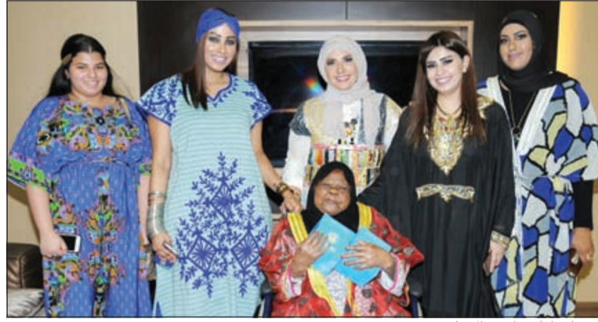
فريق (برقان) مع إحدى الامهات

الاجتماعية من خلال المساهمة في المبادرات التعليمية والثقافية والاجتماعية والصحية. ويأتي نهج حملة «ENGAGE» تماشياً مع مبادئ بنك برقان كمؤسسة مالية كويتية رائدة، بحيث يتسجم أسلوب سياساته مع احتياجات ومصالح المجتمع الكويتي.