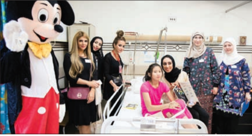
جانب من زيارات بنك الخليج

الطبية على كون بنك الخليج جزءاً لا يتجزأ من نسيج المجتمع الكويتي، حيث تأتي هذه الزيارات في إطار اهتمام البنك بالأنشطة الاجتماعية والإنسانية التي تعبر عن روح المشاركة والتواصل مع كل شرائح المجتمع من خلال تقديم الدعم المعنوي لهؤلاء المرضى الصغار.