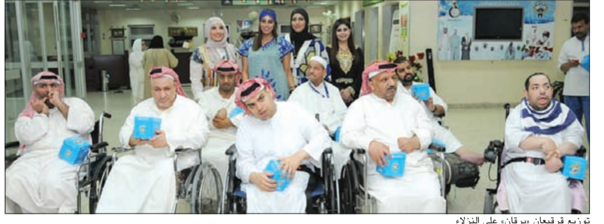
توزيع قرقيعان «برقان» على النزلاء