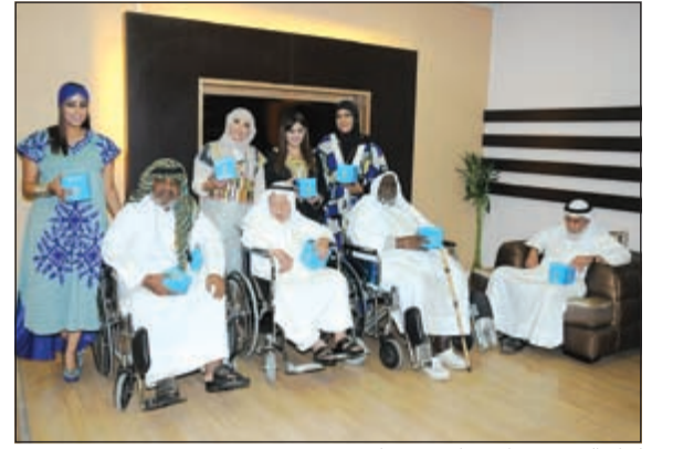
كبار السن سعداء بمبادرة «برقان»