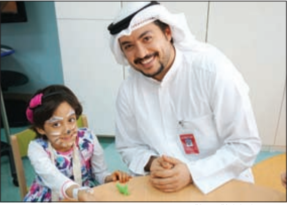
..وقرقيعان لطفة جميلة