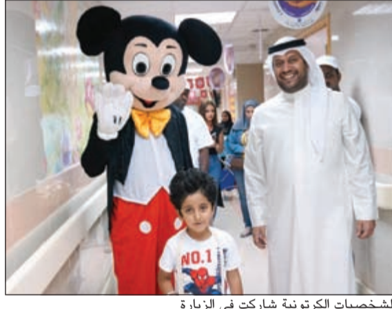
الشخصيات الكرتونية شاركت في الزيارة