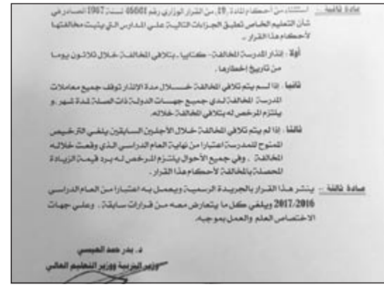
صورة قرار الوزير بزيادة الرسوم المؤرخ في 2016/6/14

مصادر تربوية مطلعة لـ «الأنباء» أن ما نشر عن وقف زيادة الرسوم الدراسية في «الكويت اليوم» في عددها الصادر يوم أمس الأول 2016 /6 /26 بشأن وقف زيادة الرسوم الدراسية، رغم أنه مهوور بتوقيع الوزير د.عيسى العيسى في تاريخ قديم هو 19 مايو. هذه الحالة سببها أن الوزير العيسى أصدر قراراً في 2016/6/14 يتضمن زيادة رسوم المدارس الخاصة بنسبة 3٪ للعام المقبل 2016/2017، ثم زيادتها مرة أخرى في العام التالي 2017/2018 بنسبة 3٪. وحول هذا الأمر كشفت