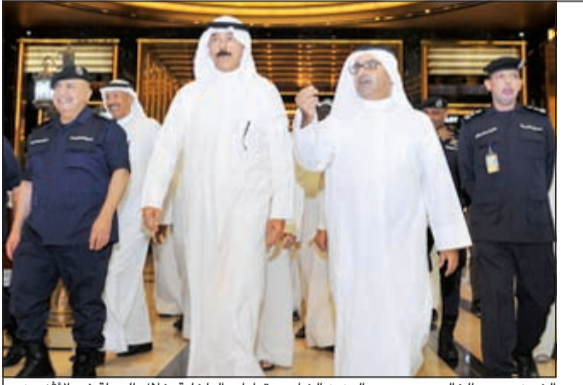
الشيخ محمد الخالد ومحمد عبدالعزيز الشايع وقيادات الداخلية خلال الجولة في الأقبية

الخالد: إدارة الأقبية طبقت الأنظمة الأمنية المتطورة للثامنين رفع سن الإيفاد للإجازات الدراسية إلى 50 عاماً