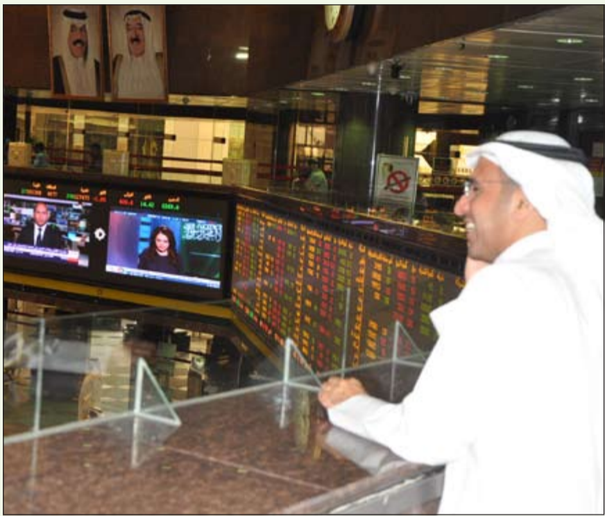
شركة البورصة تهدف إلى خلق سوق جديد قادر على استقطاب رؤوس أموال محلية وإقليمية وعالمية

وتضمنت مقترحات شركة البورصة أيضاً ضوابط جديدة لتنفيذ الصفقات ما دون الـ 5% والتي تتمثل بعضها في مبادلات بين المحافظ المالية وبعضها البعض وبين المتعاملين الأفراد وفقاً للخطط المنظمة للتداولات، فضلاً عن مقترح خاص لتنظيم دور صانع السوق.