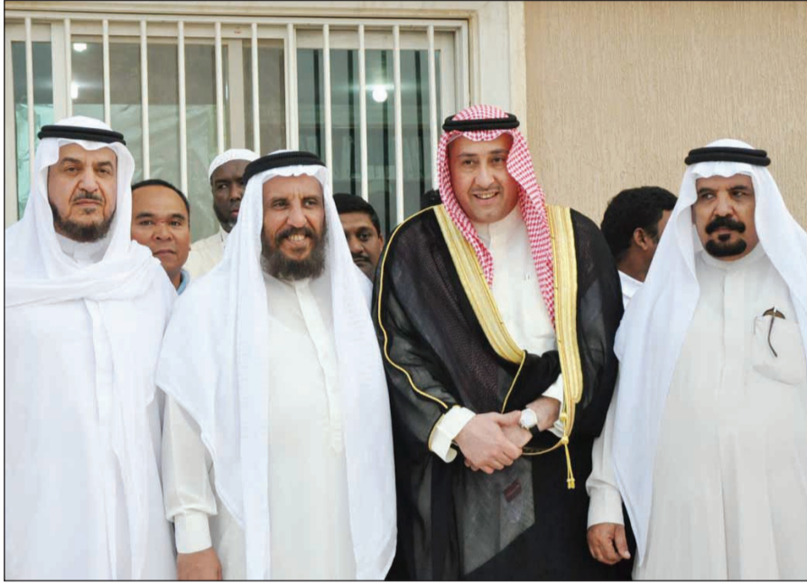
الشيخ فيصل الحمود يشارك في وداع المهتدين الجدد إلى رحلة العمرة

وهذه الحوقلة باب من أبواب الجنة، فقد أخرج أحمد في مسنده والترمذي في جامعه عن قيس بن سعد بن عبادة رضي الله عنهما أن أباه دفعه إلى النبي صلى الله عليه وآله يخدمه فقال: «مر بي النبي صلى الله عليه وآله وقد صليت، فضررتني برجله وقال: ألا أدلك على باب من أبواب الجنة؟ قلت: بلى. قال: لا حول ولا قوة إلا بالله».