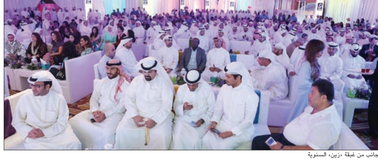
جانبا من غبقة «زين» السنوية

ويذكر جيجنهايمر قائلا: يجب أن نفخر جميعا بما حققناه خلال هذه الفترة، والتي وضعنا