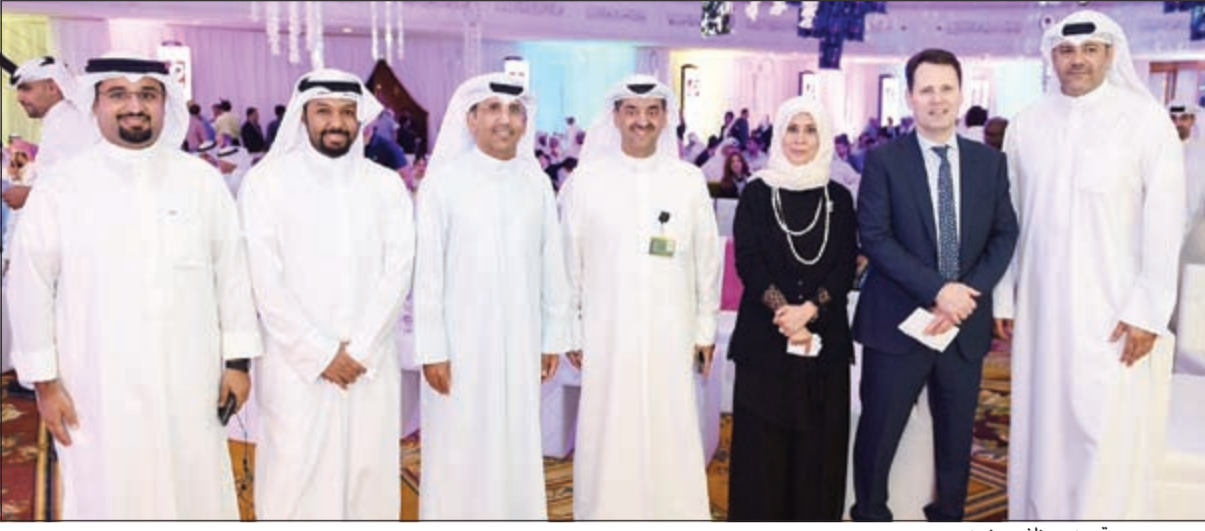
..ومع مجموعة من موظفي «زين»