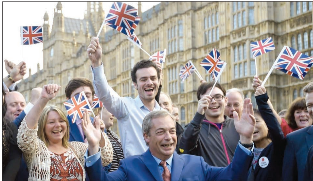
زعيم حزب استقلال المملكة المتحدة نيجل فراغ يحتفل مع انصاره بخروج بريطانيا