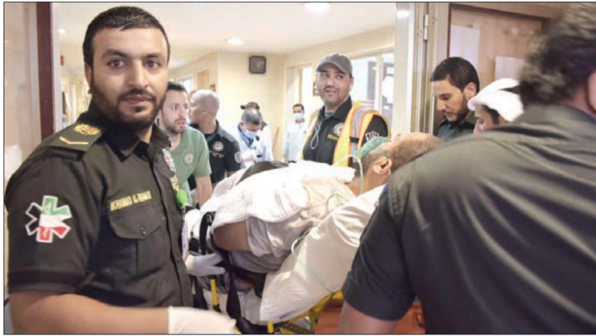
أحد النزلاء خلال تلقيه العلاج في مستشفى الجهراء