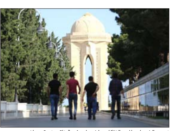
نصب الشهداء والممر التذكاري لشهداء منجبة ناهورنو قره باخ

يشكل هذا القسم من المدينة لوحة تصويرية متنوعة الألوان، فالبلدة شرقية الطران بالمقام الأول: أحيائها ضيقة تشكل مناهة لغبر قاطنيتها، وشوارعها مرصوفة بالحجارة والبلاط، وأبرز معالمها قصر الشروانشاهانيين، وخطاني كاروانسرايين، وعدد من الحمامات، ومسجد الجمعة (الذي كان قد تحول إلى معرض وطني للمسجد لفترة من الزمن قبل أن يعاد تحويله إلى مسجد). في قلب البلدة القديمة أيضا عشرات المساجد الصغيرة التي تفقد لشارات تدل عليها وعلى هويتها.