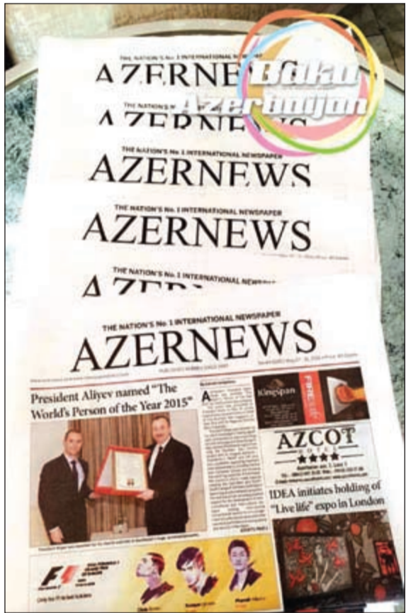
صحيفة أذربيجان نيوز وخبر اختيار الرئيس الهام علييف شخصية العالم لعام 2015

في المدينة عدة مواقع ترفيهية تؤمن للسكان والسائحين طائفة واسعة من النشاطات الثقافية الشرقية المحلية والغربية الأجنبية