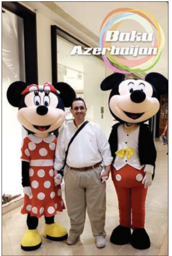
شخصيات ديزني بأحد المولات التجارية في باكو

أول ما يراه السائح فور وصوله إلى أذربيجان هو مطار