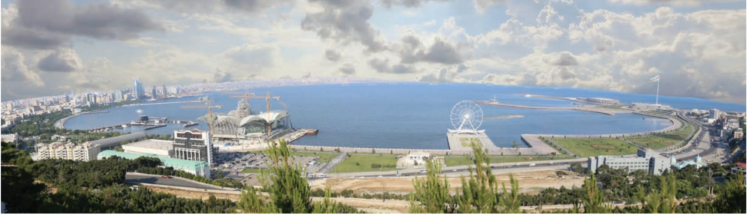
صورة بانورامية لكوننيش العاصمة باكو المطل على بحر قزوين

واحدة من أفضل الوجهات للمواطن الكويتي بموقعها الفريد وقربها من الخليج