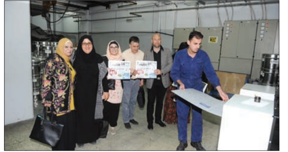
وفد مركز النور في المطبعة

كم عدد المستفيدين من المشروع؟ ● همراس: يستهدف المشروع مختلف الفئات الاجتماعية رجالا ونساء وشبابا وأطفالا ويخدم المركز حوالي 50000 مسلم يسكنون المدينة و15000 من المناطق المجاورة حيث تصل طاقة استيعاب منشآت المركز إلى 3000 شخص.