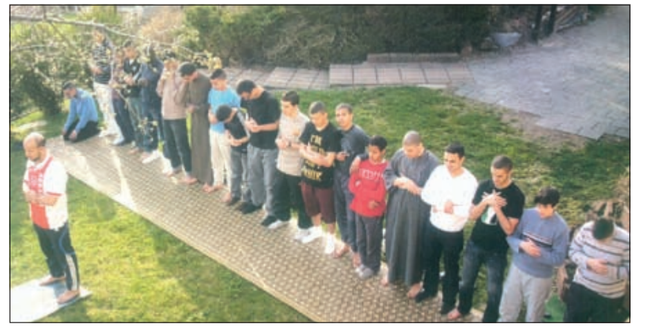
مسلمو الأزراس يؤدون الصلاة