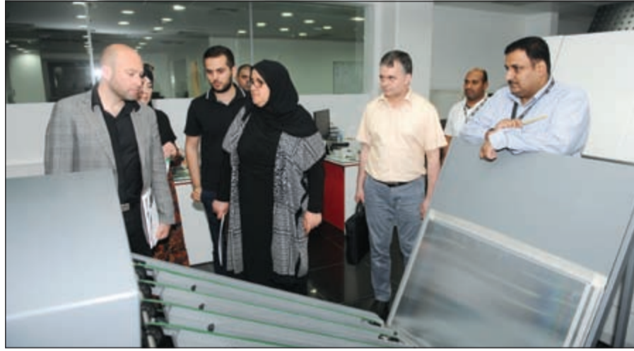
في قسم المونتاج