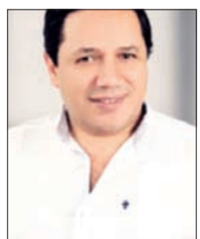
المطرب علي سليم