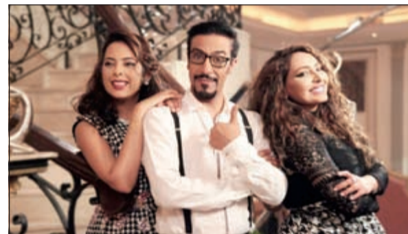
مشهد من ساق «البامبو»