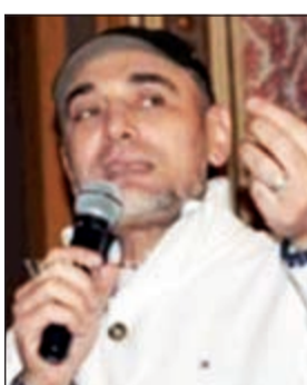
الموزع الموسيقي أمير عبدالمجيد