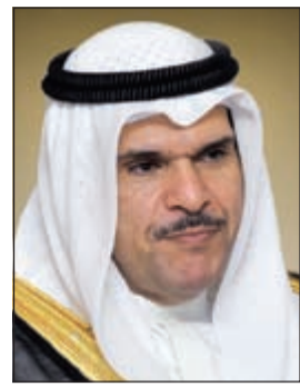
الشيخ سلمان الحمود

وأضافت ان الشيخ سلمان الحمود أكد استمرار تعاون الوزارة مع الأزهر الشريف