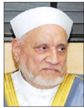
د. أحمد عمر هاشم

وأشاد بالدور المعرفي والتثويري الذي يضطلع به المركز كونه مصدرا ثقافيا دائما للشباب والناشئة ومعلما حضاريا ومقدما سياسيا، مؤكدا استمرار دعم وزارة الإعلام لأنشطة المركز العلمي وفعالياته. والتقى الشيخ سلمان الحمود أيضا سفير الكويت لدى المملكة الأردنية الهاشمية الشقيقة د. حمد الدعيح، حيث أكد جاهزية وزارة الإعلام لتغطية فعاليات ومناسبات سفارتنا في عمان بما يبرز الوجه الحضاري للبلاد.