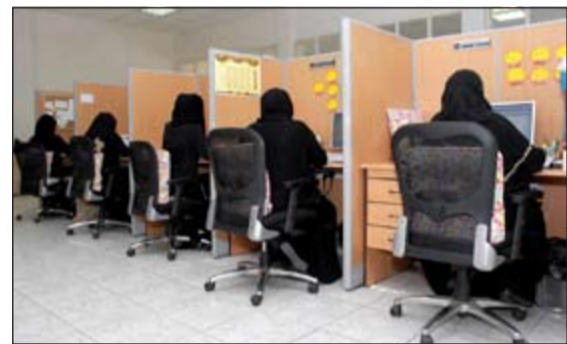
مركز الاتصال الآلي في بيت الزكاة

على المتبرع. تسويق الأيتام وعرض أسماء الدول، مع توضيح جنس اليتيم وعمره و مبلغ الكفالة حسب الدولة. تزويد المتبرع بالمعلومات عن كفالة طفلة التعلم. توجيه المتبرع لأماكن المراكز الإبرادية، وتوضيح تقديم شرح مفصل عن قنوات المتبرع، ومساعدة المتبرع على الاختيار من بينها. متابعة شكاوى المتبرعين مع إدارة تنمية الموارد والنشاط الخارجي. رفع اقتراحات المتبرعين لمكتب ضبط الجودة. كما يقدم مركز الاتصال ببيت الزكاة خدماته للمستفيدين فتشمل كلا مما يلي: شرح الأوراق المطلوبة لإنجاز المعاملة، توضيح أسباب تأجيل المعاملة، لمرجعي الخدمة الاجتماعية،