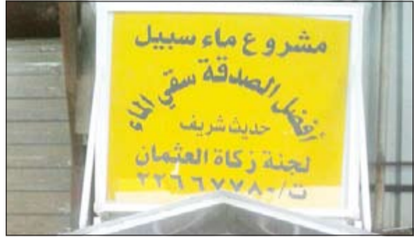
مشروع برادات المياه

البعيدة حتى يستفيد منها الكثيرون، لافتا الى انه يمكن التبرع والمساهمة في المشروع بأي مبلغ. وتابع: بفضل الله جل وعلا ثم تبرع المحسنين قامت اللجنة بتركيب ما يزيد عن 1100 برادة منذ تأسيس المشروع وشمل التوزيع كافة مناطق الكويت بل حرصنا على التواجد بقوة في المناطق الحدودية مثل منفذ الرقعي والعبدي والمناطق البعيدة جدا لنوفر لكل من تطأ قدمه الكويت الماء البارد حاملا في طياته رسالة مضمونها رحب بك في بلد الخير الكويتي وللتواصل مع اللجنة 22667780 أو 99401011.