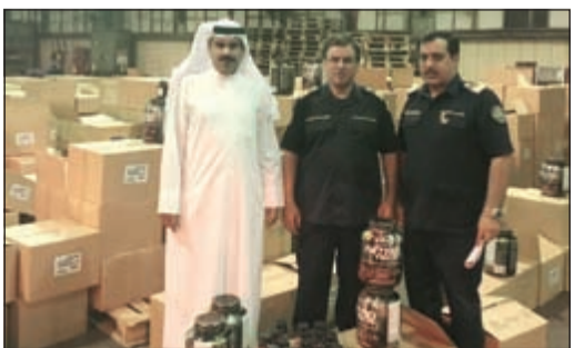
رجال الجمارك وامامهم كمية من المكملات الغذائية المقلدة