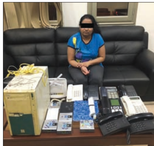
مديرة أحد وكريين وامامها المضبوطات