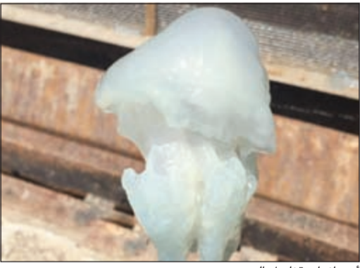
أحد أنواع قناديل البحر