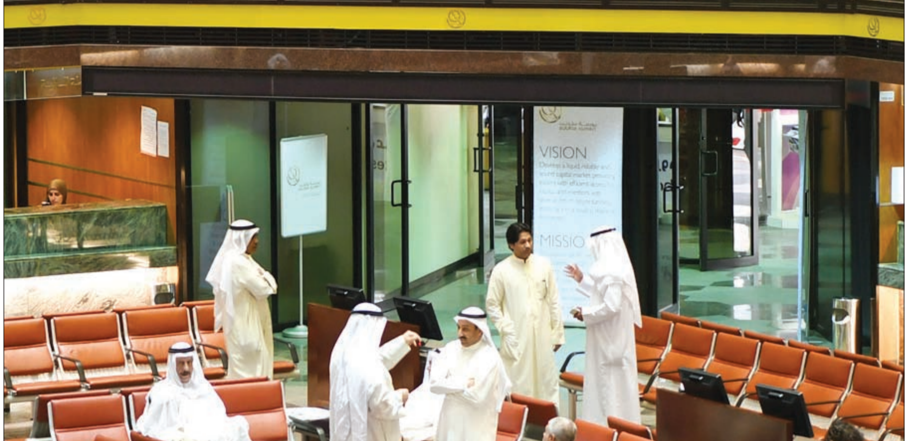
أخبار صفقة أمريكانا على شريط التداولات أمس في البورصة حيث كانت حديث المتداولين بعد أن ففزت بمؤشرات البورصة لمستويات كبيرة لم يشهدها السوق في شهر رمضان منذ الأزمة المالية (محمد هاشم)