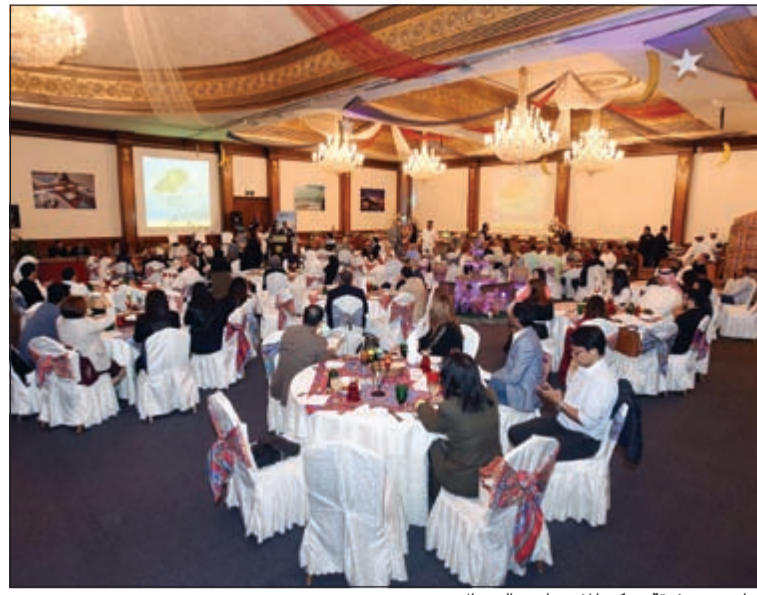
جانب من غبقة مركز المؤتمرات والرويال سويت

أعلن فندق مركز المؤتمرات والرويال سويت المنطقة الحرة عن افتتاح خيمة الموردي التي تتميز بأجمل الأجواء الرمضانية وطابعها الفريد وتصميمها المميز، حيث تتألق بالألوان الرائعة المستوحاة من الأجواء الرمضانية، وتمتلك خيمة الموردي بفرصة للاستمتاع بالليالي الرمضانية مع الإصدقاء لتوفر خيم خاصة مجهزة بالتلفاز، حيث يمكنكم متابعة برامجكم الرمضانية المفضلة كما يوجد شاشات عرض عملاقة تمكنكم من مشاهدة مباريات كرة القدم.