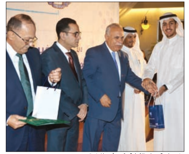
وفد جامعة عمان الأهلية يكرم أحد المتفوقين