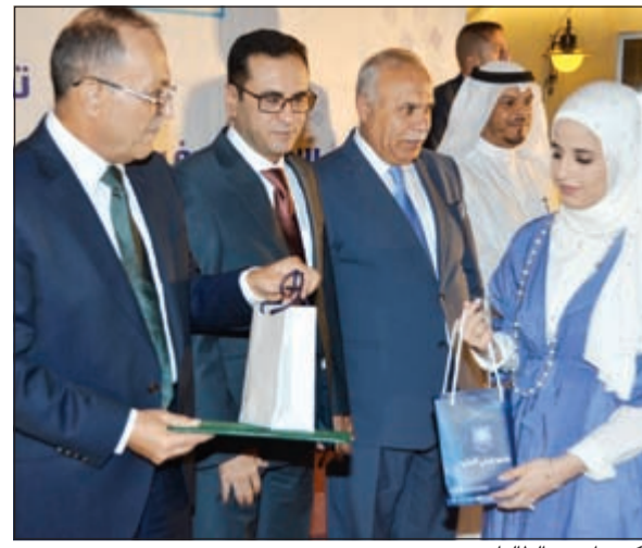
تكريم إحدى الطالبات

وذكرت إحصائية أعدتها أعلنت وزارة التربية إنشاء وإعادة بناء ما يقارب 106 مدارس خلال خططها في المشروعات الإنشائية للأعوام 2020/2019، 2016/2015. وذلك في مختلف المناطق التعليمية.