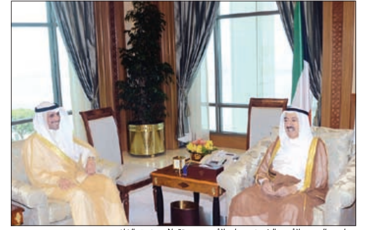
صاحب السمو الأمير الشيخ صباح الأحمد مستقبلا مرزوق الغانم