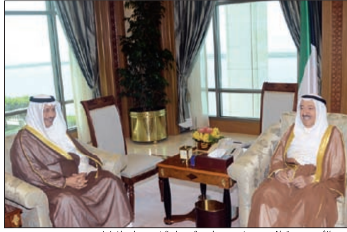
سمو الأمير مستقبلا سمو رئيس مجلس الوزراء الشيخ جابر المبارك

استقبل سمو ولي العهد الشيخ نواف الأحمد بقصر السيف صباح أمس رئيس مجلس الأمة مرزوق الغانم. واستقبل سمو ولي العهد بقصر السيف صباح أمس سمو رئيس مجلس الوزراء الشيخ جابر المبارك. كما استقبل سمو ولي العهد الشيخ نواف الأحمد بقصر السيف أمس سماحة السيد عمار عبدالعزيز الحكيم رئيس المجلس الأعلى الإسلامي في العراق والوفد المرافق له، وذلك بمناسبة زيارته للبلاد. وقد رحب سموه بسماحته ضيفا عزيزا في