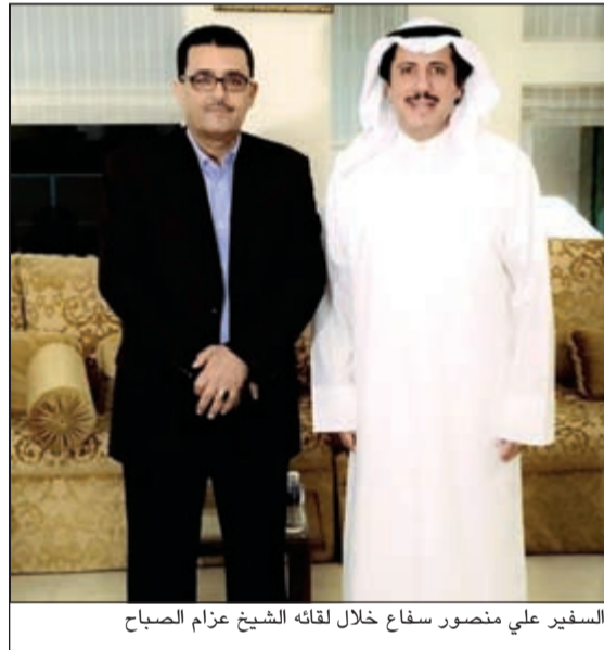
السفير علي منصور سقاع خلال لقائه الشيخ عزام الصباح

وذكرت أن اختراعها الحاصل على براءة الاختراع من الولايات المتحدة الأميركية يساعد المكفوفين بشكل كبير على عملية الكتابة، مبيته أنه بفضل لسن يضطر المكفوف لاستخدام الطريقة التقليدية في الكتابة التي تتطلب الضغط على يديه بل يستخدم قلم المسمار البسيط. وأوضحت أن اختراعها عبارة عن قلم بالحجم العادي