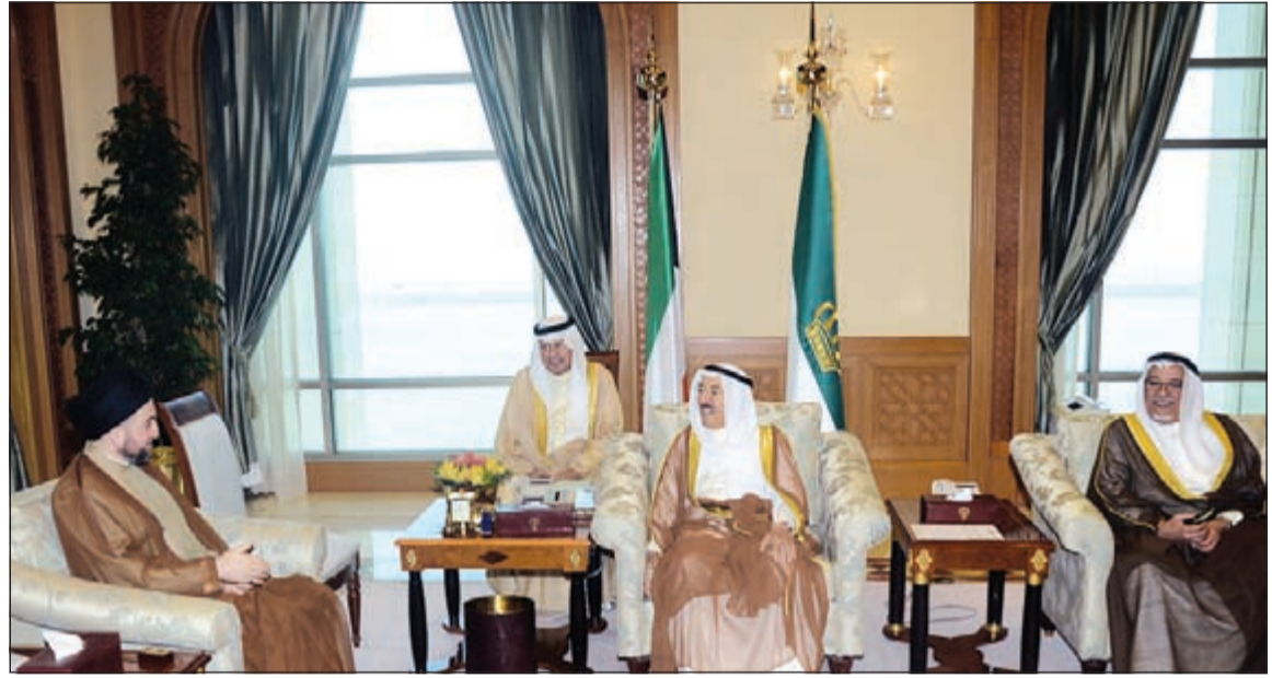
صاحب السمو الأمير مستقبلا السيد عمار الحكيم وبيدو الشيخ علي الجراح والسفير أحمد فهد الفهد

استقبل صاحب السمو الأمير الشيخ صباح الأحمد بقصر السيف صباح أمس سمو ولي العهد الشيخ نواف الأحمد. كما استقبل سموه بقصر السيف صباح أمس رئيس مجلس الأمة مرزوق الغانم. واستقبل سموه بقصر السيف ظهر أمس سمو رئيس مجلس الوزراء الشيخ جابر المبارك. كما استقبل صاحب السمو الأمير الشيخ صباح الأحمد بقصر السيف صباح أمس رئيس المجلس الأعلى الإسلامي العراقي سماحة السيد عمار عبدالعزيز الحكيم والوفد المرافق، وذلك بمناسبة زيارته للبلاد. وحضر المقابلة نائب وزير شؤون الديوان الأميري الشيخ علي الجراح.