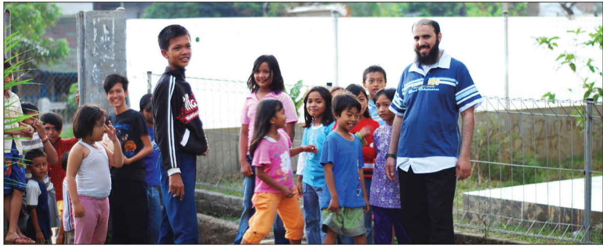
... ويشارك الأيتام العابهم

بيت الزكاة واسكنهم فيها ووجدت عنده عدة كراتين مغلقة عليها مكتب اغائة مسلمين، وسيكون الاكل حلالا، وسحبني الرجل بيدي الى الغرفة التي يعيش فيها مع اسرته في المخيم وهي عبارة عن مدرسة قديمة قام بتأهيلها دولية من الصليب الاحمر، وقال لي: هذا لحم خنزير ولم ناكله رغم جوعنا لأننا مسلمون والآن سناكل من ايديكم، تأثرت كثيرا بكلام هذا الرجل المسلم الصالح وقمت فورا مع مجموعة من المتطوعين بشراء عجل كبير ونبحناه ووزعنا لحمه على الاسرة واللاجئين، واصر الرجل ان يضيفني فجلست ووجدت اطفالا وامرأة كبيرة في السن وشابيتين، قال هذه ابنتي والثانية زوجة ابني، وهؤلاء اطفالهم، ولما سألت عن الاب اخبرني ان احد ابناءه قتل في مذبحة كوسوفا والآخر مفقود حتى الآن وانه لا يجد من يعول هؤلاء الاطفال، وهذا الموقف لا استطيع نسيانه أبدا.