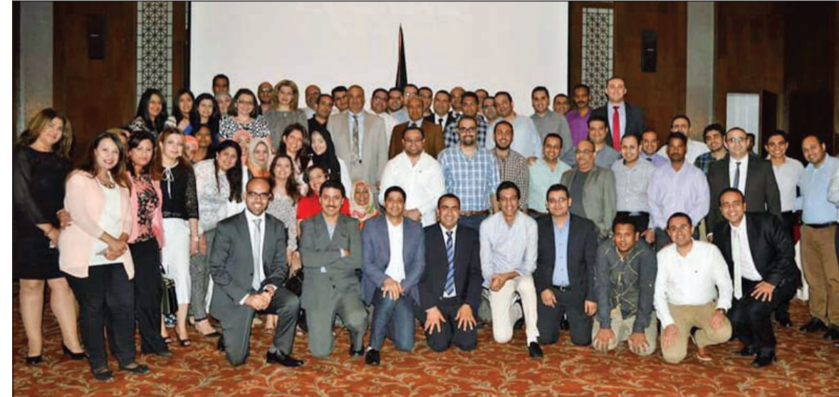
فريق مجموعة صيدليات رويال

كعادتها السنوية اقامت رويال (صيدليات رويال - وفروعها) حفل الإفطار السنوي بفندق هوليداي إن السالمية، وقد جاء الاحتفال هذا العام مواكبا لاحتفالات المجموعة بافتتاح فروعها الجديدة بالفحاحيل، حيث قامت المجموعة بافتتاح 3 صيدليات جديدة بمنطقة الفحاحيل، وجاء هذا الافتتاح تلبية لنداء أهالي المنطقة العاشرة بافتتاح المزيد من أفرع المجموعة، حيث أن رواد الصيدليات من أهالي المنطقة قد اعتادوا على الأداء المتميز لمجموعة صيدليات رويال. وضم الاحتفال الكثير من