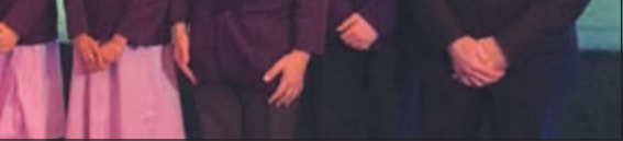
لقطة تذكارية للطلبة المشاركين والشرفين