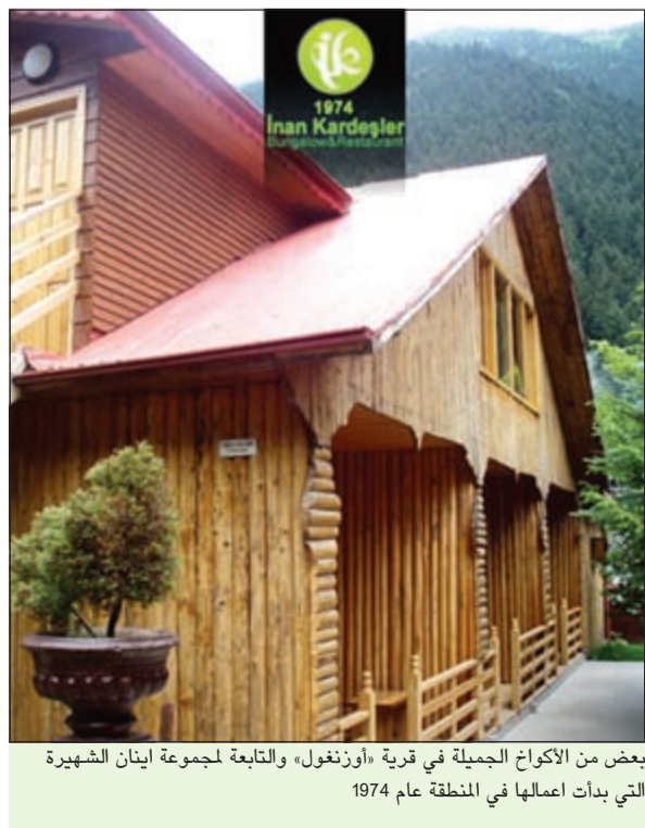
بعض من الأكواخ الجميلة في قرية «أوزنغول» التابعة لمجموعة اينان الشهيرة التي بدأت اعمالها في المنطقة عام 1974

جمع هو وابن خاله تحفا فنية نادرة وقديمة، معظمها من التراث العثماني والعربي من الآلات الموسيقية والأشياء المستخدمة قديما في الحرب والمائل والمشرب والحياة الاجتماعية. ويمكن زيارة المتحف بالقرب من الأكواخ وتمضية ليلة رائعة فيه على وقع الأغاني التركية التي يؤديها اينان وابن خاله على آلات البرق والعود. يمكن التواصل والحجز لفنادق اينان او الأكواخ على الايميل التالي: inanhamit@msn.com. علما أنه يفترض الحجز قبل وقت كاف من السفر نظرا لضغط الكبير من السياح على هذه المنطقة.