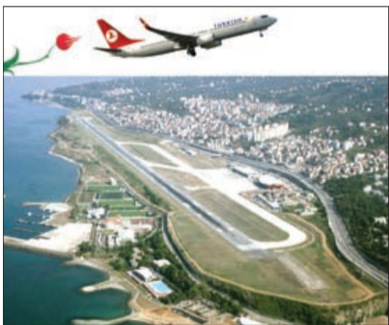
مطار طرابزون حيث ستدشن «التركية» رحلاتها من الكويت إليه هذا الشهر

بما فيها 240 وجهة دولية و49 وجهة محلية. وبحسب استطلاع رأي «سكاي تراكس» لعام 2015، تم اختيار الخطوط الجوية التركية «أفضل شركة طيران في أوروبا» للعام الخامس على التوالي، و«أفضل شركة طيران في جنوب أوروبا» للعام السابع على التوالي. كما حصلت الخطوط الجوية التركية، التي فازت بجائزة «أفضل خدمة طعام على متن الدرجة السياحية» في العالم في 2010 وجائزة «أفضل خدمة طعام على متن درجة رجال الأعمال» في العالم في 2013 وجائزة «أفضل خدمة طعام على متن درجة رجال الأعمال» في 2014، على جائزة «أفضل خدمة طعام في صالة سفر درجة رجال الأعمال» في العالم لعام 2015 ضمن استطلاع «سكاي تراكس».