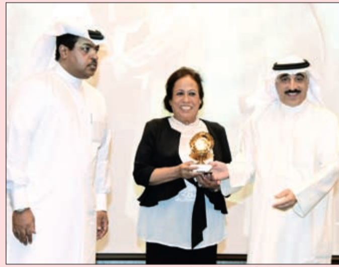
.. وتكريم سيدة الشاشة الخليجية حياة الفهد