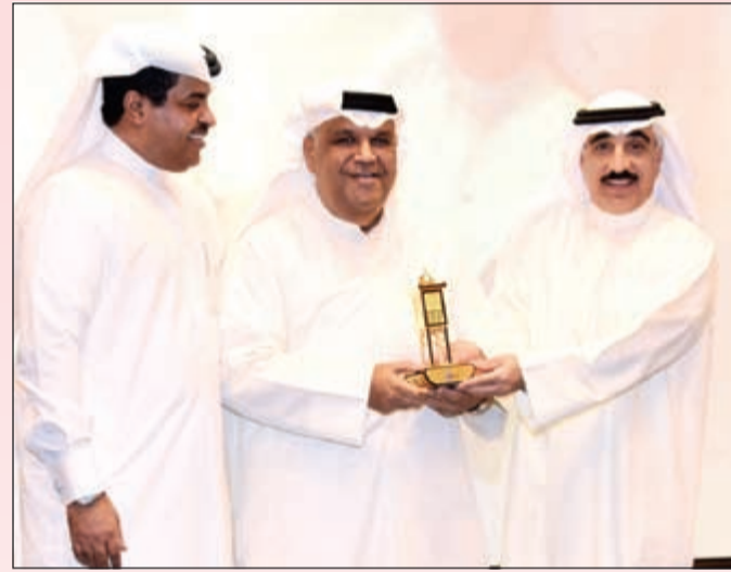
وتكريم المطرب الكبير نبيل شميل