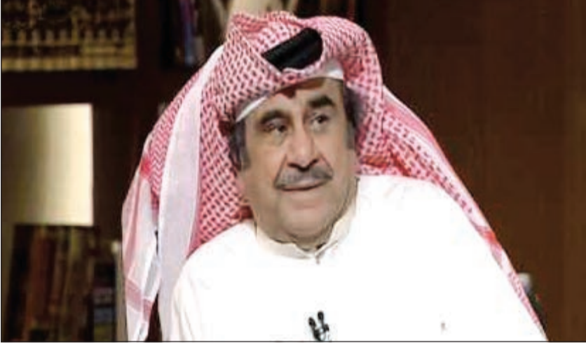
الفنان الكبير عبدالحسين عبدالرضا

الشريان، رائدات الفن الكويتي حياة الفهد ومريم الصالح وسعاد عبدالله والراحلة مريم الغضبان وقدم لهن الشكر لأنهن السبب في دخول النساء الكويتيات للتمثيل.. كبير بوعدنان.